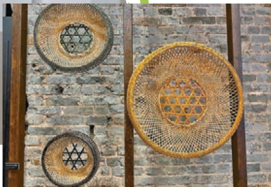
陳詠笙《菊花紋小夜燈》