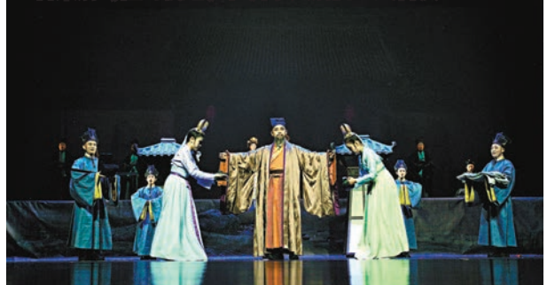
音樂劇《禮門義路》在濟寧大劇院正式首演。