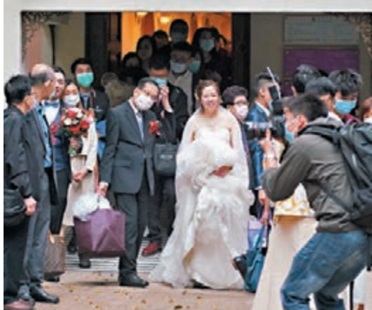
婚禮人數上限獲放寬至50人。圖為新人參加婚禮。

備婚禮，期望新措施實行後，籌備婚禮的準新人可回升至原本的八成。她說，「新人點都會買吓戒指、首飾，換張大床、裝修吓屋企咁……婚嫁產業鏈可帶動本地零售及餐飲業復甦。」