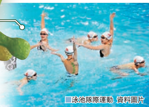
泳池隊際運動 資料圖片