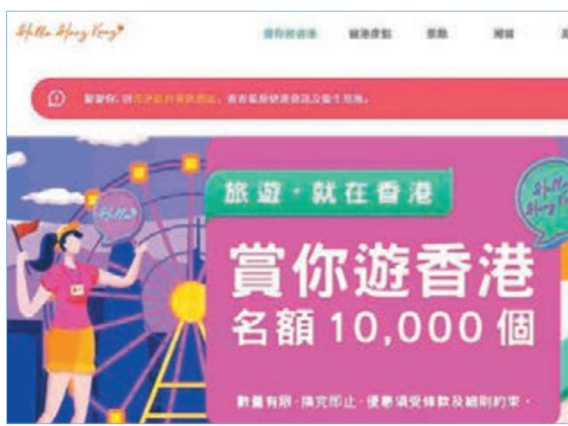
「賞你遊香港」計劃名額限定一萬個。網站截圖

「賞你遊香港」提供約50個由不同本地旅行社特別設計的半天或以上的深度遊行程，計劃名額限定一萬個，旅行團包括導遊服務、來回交通、一餐膳食及基本保險，行程會到訪至少兩個景點，當中有城中的打卡熱點或別具本地文化特色的地點，旅發局下星期二（27日）將會把相關本地遊旅行團的資料上載至活動網站（HolidayHK.com/zh-hk/free-tours）。