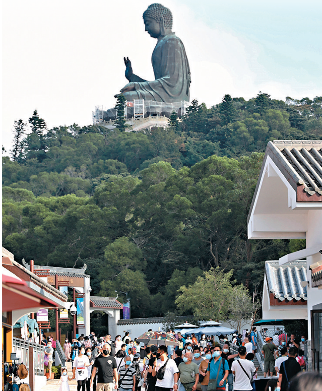
政府放寬本地團人數上限至30人，旅發局即推出優惠谷市道。圖為本地旅遊熱點之一的昂坪市集。