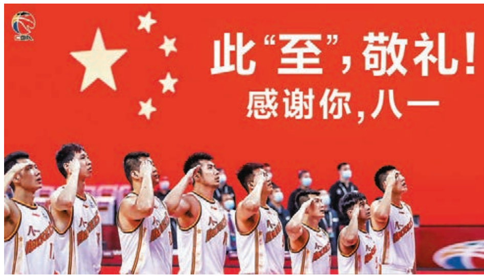
CBA向已退出聯賽的「八冠王」八一男籃致敬。