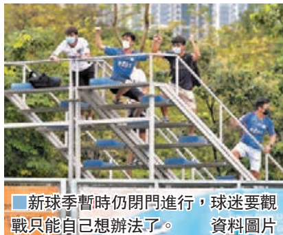
新球季暫時仍閉門進行，球迷要觀戰只能自己想辦法了。資料圖片

香港文匯報訊(記者 黎永淦)新一屆港超球季周六揭幕，不過聯賽及其他盃賽賽制仍未落實，消息指有球隊眼見盃賽抽籤不利，聯同友好球會反對聯賽改踢3循環，目的是要足總盃改制，將失利影響減至最低。