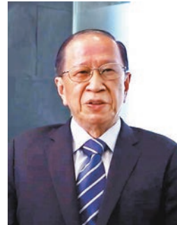
香港足球總會主席貝鈞奇。

受到疫情影響，上一球季歷時409日終能完成。足總主席貝鈞奇對此感到欣慰：「近年香港體壇充滿不確定性，上一季憑着大家對足球的熱誠和支持，在種種限制下終完成賽事。新一季的準備時間不多，然而參賽的超聯球會依然積極增兵及備戰，相信新球季會繼續充滿競爭性和驚喜。在此艱難時期，感謝各位對我們的諒解和支持。同時感謝各傳媒朋友對港超聯的關注和報道，並不時傳送賽事的最新消息。」