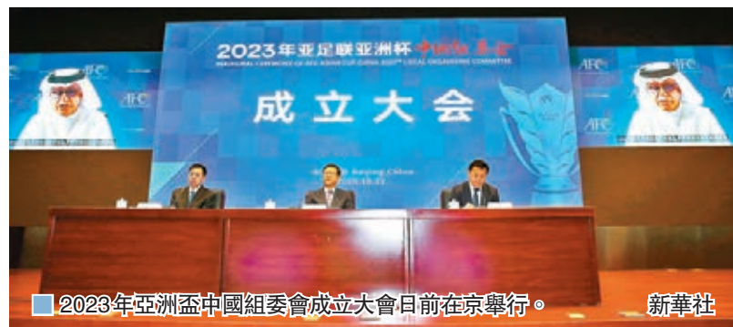
2023年亞洲盃中國組委會成立大會日前在京舉行。