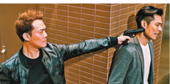
天華和柏豪角色對立狀態。