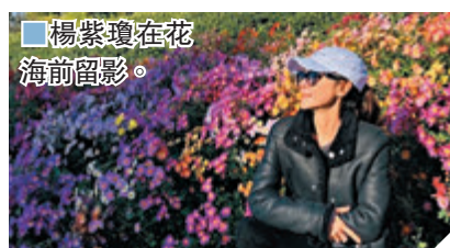
楊紫瓊在花海前留影。

李日朗也表示受疫情影響，他要轉型做網上直播帶貨，貨品包括食物、護膚品及珠寶等，他笑道：「我覺得最後是商家賺到錢，因為都賺了我的錢，每種貨品我都買來試，像以前出唱片自己都要買第一張，一邊消費一邊賺錢。」李日朗稱會小心控制自己的購買慾，表示最初不習慣要連續幾小時在網上叫人買貨，最成功的經驗是一個鐘內賣出600份牛扒。李日朗稱有意開網店做轉運生意，可以讓他在外地入貨後再轉到其他地方，如一個網絡分銷商。