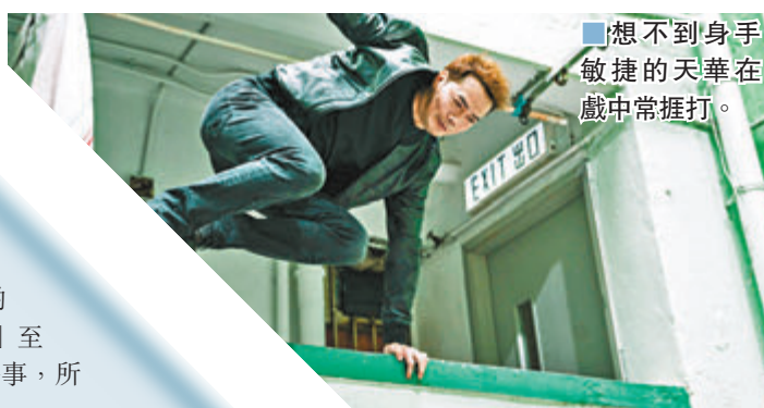
想不到身手敏捷的天華在戲中常捱打。

據知，這對愛侶習慣以500天作為紀念，距離上次慶祝是5500天的時候，那時Jean依舊送玫瑰花作為禮物。網友們看兩人如此甜蜜，也紛紛留言獻上祝福。