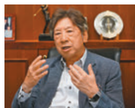
湯家驊直言近年不斷有人測試中央底線，中央有責任將底線劃清楚。資料圖片

同政策提出反對意見沒有問題，唯獨是要衝擊國家制度、「一國兩制」、國家領土完整才會出問題。他重申，香港問題在於香港人能不同心協力讓「一國兩制」繼續落實，並呼籲「泛民」不要「總辭」，認為這不符合議會精神，更可能「返唔到去」，屆時將「無人有益」。