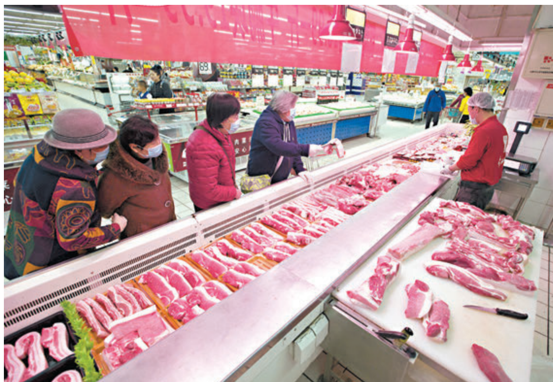
豬肉價在連續上漲19個月後首次轉降。圖為昨日，山西太原，民眾在超市選購豬肉。

香港文匯報訊 據新華社報道，記者從昆明海關獲悉，8日、9日，2,000頭歐洲種豬抵昆明長水國際機場，在海關監管下按要完成通關手續辦理。