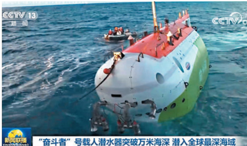
「奮鬥者」號昨日成功在西太平洋馬里亞納海溝坐底科考，坐底深度10,909米。 視頻截圖

據悉，在潛水器布放時，水面溫度約為30攝氏度，而隨著潛水器下潛至萬米海底，艙內的溫度僅約20攝氏度，並伴隨溫度下降。尤其坐在中間的主駕駛員位置靠近球殼，體感溫度格外寒冷，腳底溫度僅1攝氏度至2攝氏度。為此，