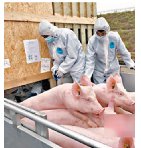
2,000頭歐洲種豬日前運抵昆明長水國際機場。圖為當地檢疫人員與9日法國進口的種豬。