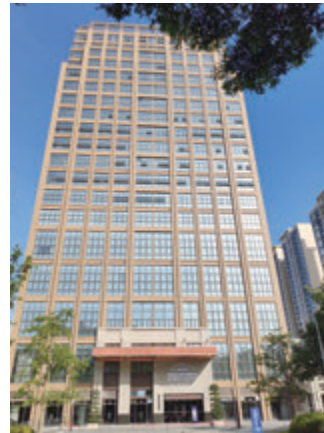
灣區新技術新產品展示中心外觀圖。