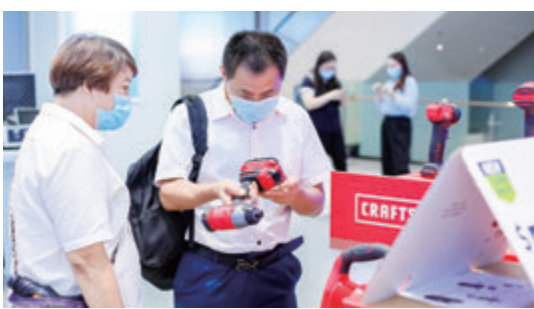
灣區新技術新產品展示中心，觀看企業產品。

栽梧引鳳。集羣四海智慧，廣納八方英才。「希望深圳是我項目落地的地方，寶安更是我理想的選擇之一，這裡配套政策完善，交流環境很好，希望在接下來的時間裡，可以了解到寶安相關政策和人文環境，為項目落地做好準備。」在第七屆寶安賽獲得團隊組一等獎的靈起科技（深圳）有限公司負責人如是說。