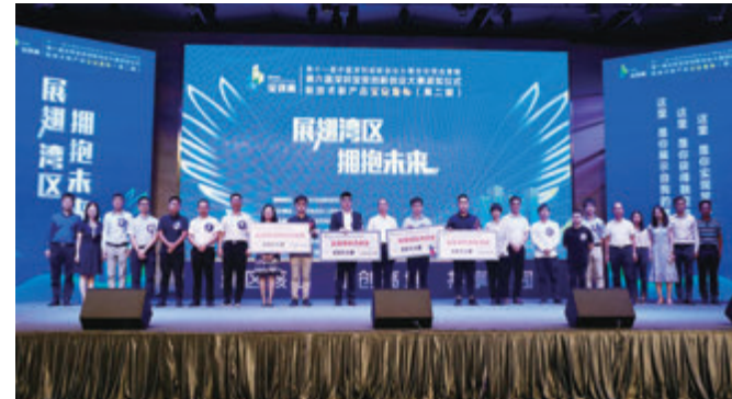
第十一屆中國深圳創新創業大賽寶安預選賽暨第六屆深圳寶安創新創業大賽頒獎儀式。