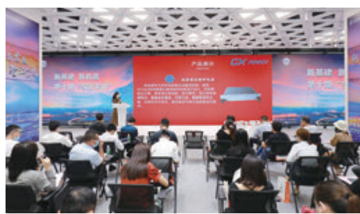
2020年7月9日第十期寶安發布。