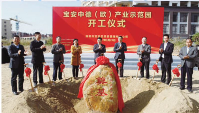
2017年1月22日，寶安中德（歐）產業示範園正式動工建設，標註着寶安當好「中國製造2025」與德國「工業4.0」對接的先行區又邁出重要一步。