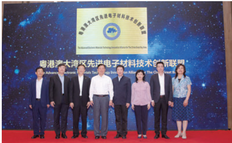
「粵港澳大灣區先進電子材料技術創新聯盟」揭牌。聯盟聯合DT新材料、尋材問料等機構舉辦了3場學術論壇，組織十餘家聯盟企業參加中國電子信息博覽會集成電路產業集羣展；與鵬鼎、容大感光、博敏電子、信維通信等開展技術對接會議20餘次，服務寶安企業100餘家。目前，寶安科創局正協助電子材料院申報國家集成電路材料技術創新中心。

今年7月底，寶安又一創舉贏得全國矚目：在全國率先發布了縣區級工業互聯網發展白皮書，上線了寶安區工業互聯網標識解析綜合二級節點，全面吹響工業互聯網提速發展的號角，為全國工業互聯網發展探索「寶安路徑」。