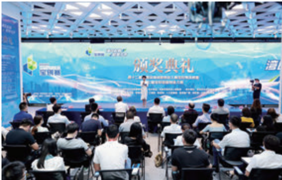
第七屆寶安創新創業大賽頒獎典禮。