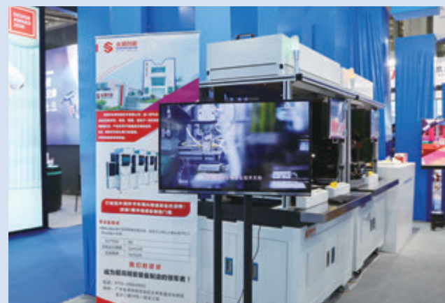
高交會企業展區——高端手機鏡頭鏡片組立機。

治理之變，不僅僅奏響「水產城共治，人水和諧共生」的樂章，還有描繪新時代基層治理體系建設的美麗畫卷。