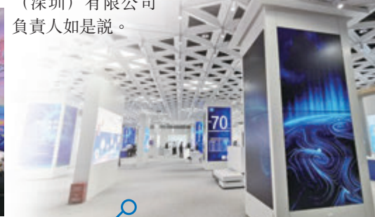
灣區新技術新產品展示中心館內實拍。