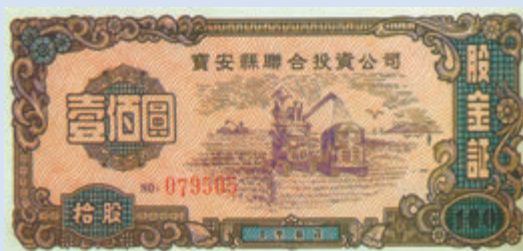
1991年6月25日，全國第一家縣級企業股份有限公司股票——寶安企業（集團）股份有限公司（原寶安縣聯合投資公司）股票在深圳證券交易所上市交易。

大潮奔湧逐浪高，在先行示範區建設的新徵程上，必須謀劃未來發展。為完善現代化產業體系，寶安已經謀劃好「四大經濟」的發展藍圖：以5G基礎設施建設為牽引打造智能經濟高地，以國際會展中心為龍頭加快發展會展經濟，以海洋新城規劃建設為載體布局發展海洋經濟，以深圳寶安國際機場為依托爭創國家級臨空經濟示範區。