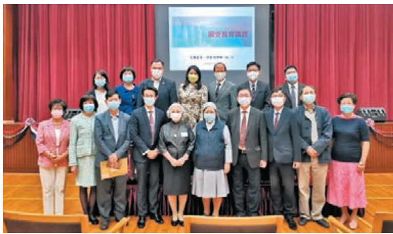
香港直接資助學校議會舉辦「國安教育講座」，實主合影。

隨着香港國安法實施，教育局早已提醒學校，開展國安教育是學校應有之責，局方亦會全力支持學校做好相關工作。為加強培訓教師的國安意識，教育局課程發展處前日舉辦「國家安全與我們日常生活」知識增益研討會，由基本法推廣督導委員會委員李浩然擔任講者，從「總體國家安全觀」角度，介紹國家安全的相關概念。另外，香港直接資助學校議會當日亦舉辦了「國安教育講座」，由前律政司司長梁愛詩擔任主講嘉賓。兩個講座有超過2,100名教師出席或網上參與，業界反應熱烈。