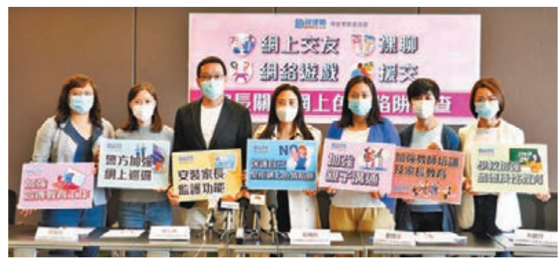
民建聯的「家長關注網上色情陷阱調查」結果發現，83%受訪家長擔心子女會跌入網上色情陷阱。

香港文匯報訊（記者 高鈺）民建聯婦女事務委員會引述警方資料顯示，在疫期間經網上交友解悶涉及裸聊勒索案件，今年上半年已達206宗，遠高於去年全年的171宗，據悉，裸聊年紀最小的受害人只有12歲。該組織進行的一項調查顯示，大部分家長會讓子女獨自上網，不過，83%受訪家長直言，擔心子女會跌入網上色情陷阱。雖然如此，但近半家長從來無和子女談及性教育，更遑論灌輸正確的性觀念。