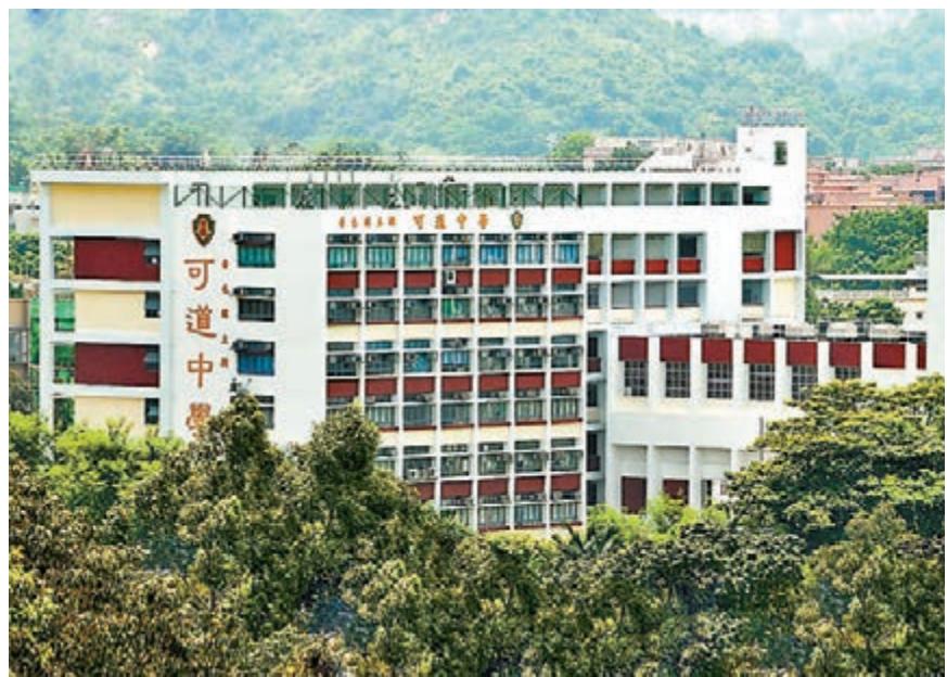
該報料讀者曾去信教育局，指一名曾參與反政府活動的城大生事隔兩年突然重返母校可道中學重讀中六。