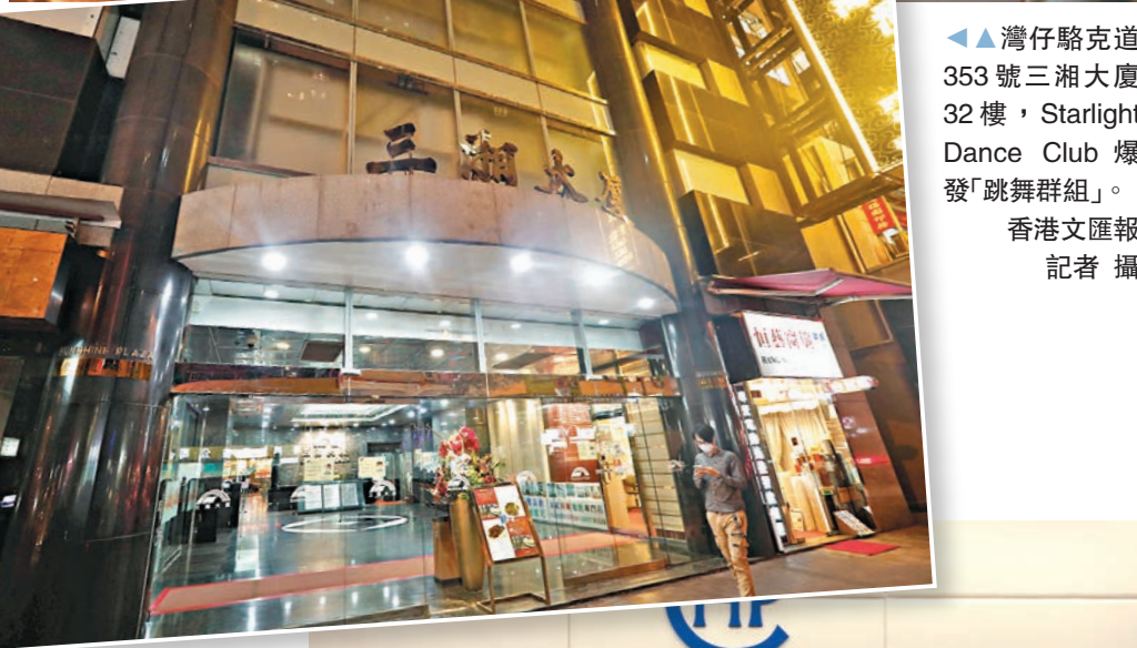
▲灣仔駱克道353號三湘大廈32樓，Starlight Dance Club爆發「跳舞群組」。