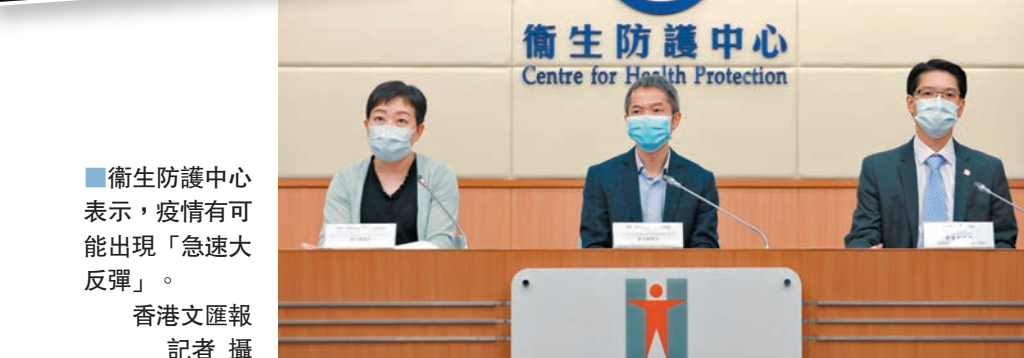
▲衛生防護中心表示，疫情有可能出現「急速大反彈」。