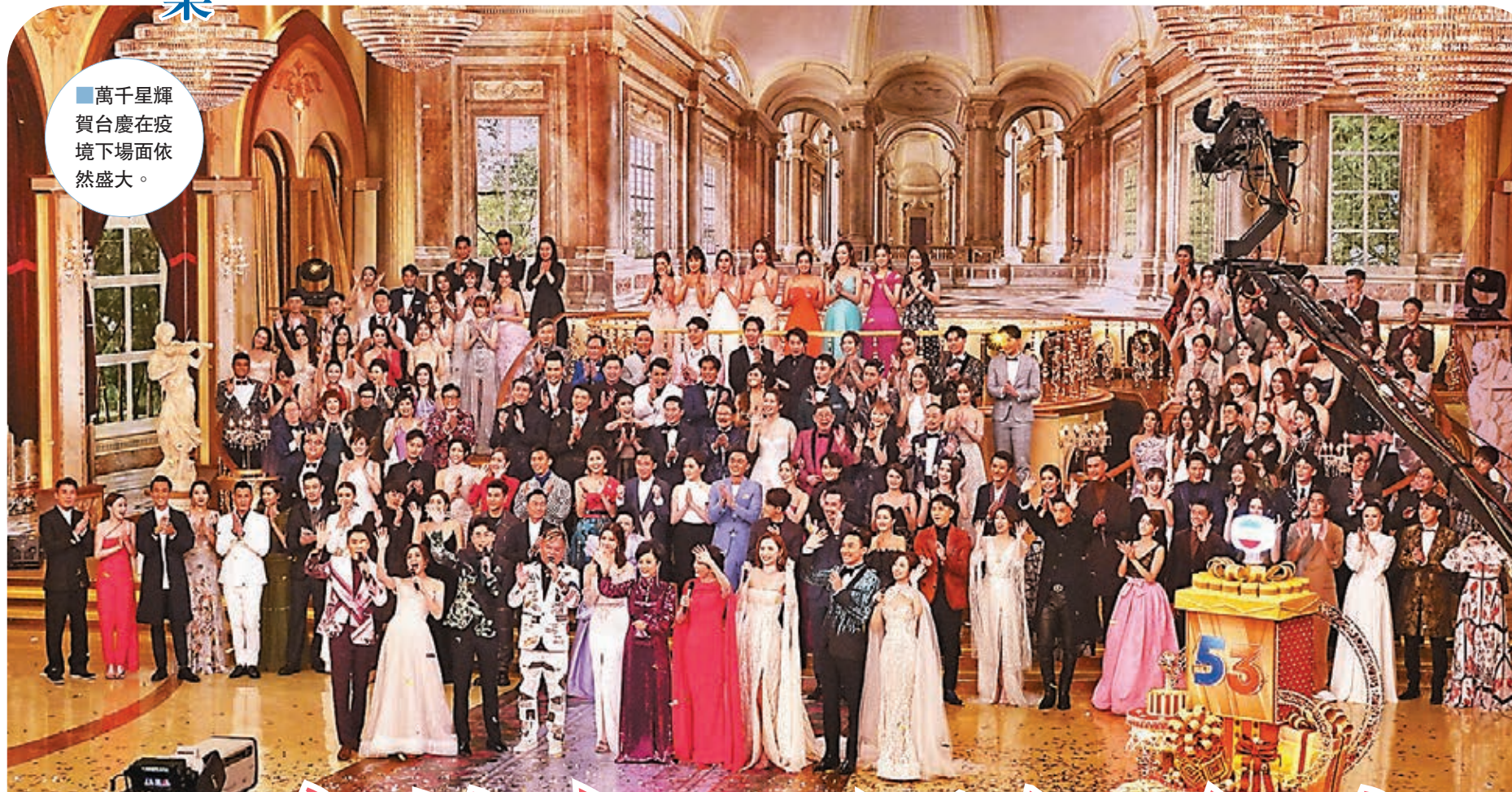
萬千星輝賀台慶在疫境下場面依然盛大。