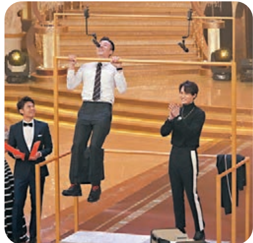
周柏豪和胡鴻鈞玩住引體上升兼唱歌。