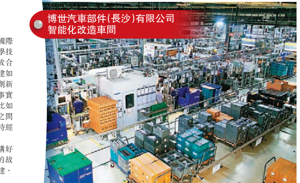
博世汽車部件(長沙)有限公司 智能化改造車間