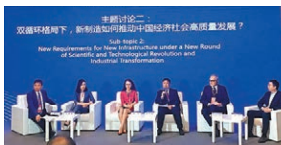
多家跨國公司負責人表示,「雙循環」戰略是外資企業的重大機會。

對於一些人擔心中國會不會由於「內循環」而與世界脫軌。張燕生說,未來,只要看三個基本事實就可以。第一,「雙循環」新發展格局下,未來關稅率會進一步下降,非關稅率會進一步取消,貿易投資便利化會進一步加快,服務業的開放會進一步擴大。第二,「雙循環」是否推動