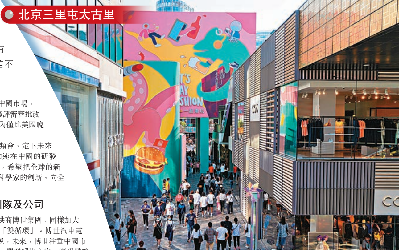
北京三里屯太古里

北京新世紀跨國公司研究所所長王志樂指出,中國正在從政策導向型的開放,邁向以規則等制度性為基礎的開放,必將帶來營商環境的進一步改善,對跨國公司來說是重大機遇。