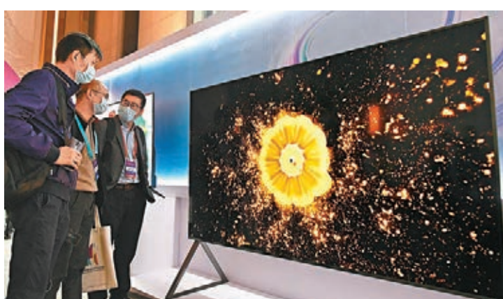
「大尺寸」的大屏和「個性化」的定製將是顯示產業新需求。圖為參觀者在2020世界顯示產業大會諮詢了解京東方98寸4K BD Cell電視。

中國電子信息產業發展研究院副院長劉文強介紹,從新顯示呈現的內容來看,將來定製化的顯示需求會不斷攀升,遊戲、短視頻、車載、醫療等新應用,對顯示產業的發展都會提出一系列的新要求。