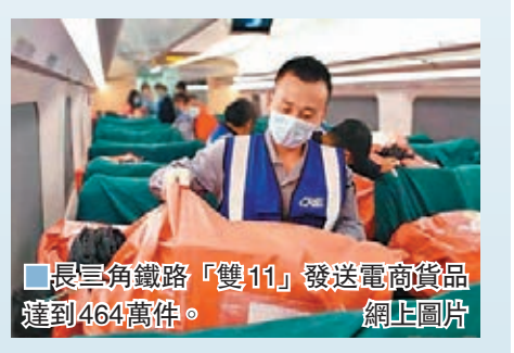
長三角鐵路「雙11」發送電商貨品達到464萬件。

此外,加強直營貨品運輸和開闢郵件高鐵通道是今年電商黃金周運輸的亮點之一。其間,中鐵快運上海分公司深入對接海爾、大華、雅戈爾等製造加工企業,開展家電、醫藥、服裝、食品等貨品直營運輸,減少中間流通環節,進一步降低生產企業物流成本。同時加強與中國郵政集團有限公司的合作,首次在上海虹橋、杭州東和寧波三大站開行9條到哈爾濱、蘭州等地的高鐵郵路,通過高鐵通道批量運輸郵件包裹。