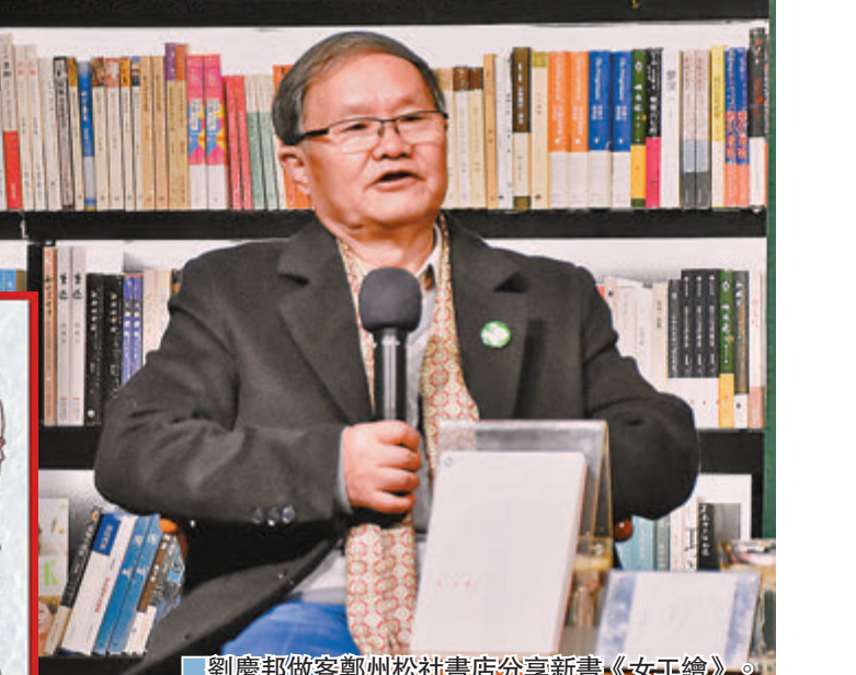
劉慶邦做客鄭州松社書店分享新書《女工繪》。