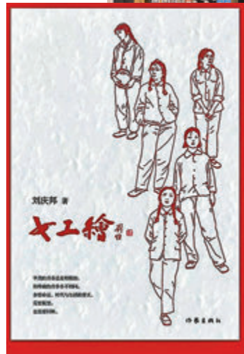
劉慶邦新書《女工繪》