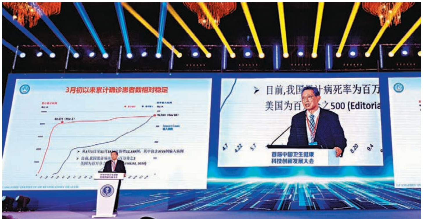
鍾南山在首屆中國衛生健康科技創新發展大會上強調，香港疫情要控制，全民檢測是根本。

須根本上斷本土病例 鍾南山直言，香港第一次的全民檢測做得不是很成功，全港800多萬的人口，只有170萬人做了核酸檢測，數量遠遠不足。但他也很高興地看到，現在有越來越多的香港市民開始主動排隊去做核酸檢測，「這些主動去核檢的人，他們的觀念不僅是為了自己的健康，也為了他人的健康。」 全民檢測的好處有什麼呢？很重要的作用就是把患病的和健康的分開，通過集中收治到香港亞洲國際博覽館，類似方艙醫院的地方治療，以切斷感染源，阻止疫情蔓延。「我多次有這個願望，現在也還是在反覆地跟我的香港朋友說，希望在香港還是要有一個全民的檢測，才能從根本上阻斷本土病