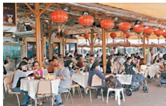
■專家顧問許樹昌建議收緊食肆營業時間。圖為周日西貢碼頭旁的食肆座無虛席。

許樹昌昨日指出，近日有多宗不明源頭個案，反映病毒已由歌舞群組擴散至很多層面，社區有廣泛的隱形傳播鏈，預料第四波疫情可能會持續至聖誕及新年。他強調現時必須防止室內外人聚集，他已建議政府收緊社交距離措施，包括要求食肆提早至晚上10時關門、關閉卡拉OK等高危場所，以及暫停舉行演唱會等。