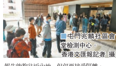
屯門兆麟社區會堂檢測中心。

香港文匯報訊(記者 美釵)政府在粉嶺和興社區會堂及屯門兆麟社區會堂增設的兩間社區中心，昨日投入運作，但早上僅有少量市民到場，有市民表示曾到黃大仙酒樓跳舞，但指跳舞時也有戴口罩，相信不會受感染；亦有醫院員工前往檢測，透露醫院防疫措施不足。 粉嶺檢測中心昨早只有少量市民等候檢測，有工作人員舉起標示，把人群分為「自費檢測」及「特定群組」排隊，市民魚貫入場，毋須排隊。屯門檢測中心則有市民要排隊候候檢測，場外張貼告示提醒市民即使有報告能夠往返內地，但仍要接受隔離。 於醫院工作的張小姐指醫院防禦措施不足，「淨係叫我哋戴口罩、勤洗手同埋界酒精搓手液我哋」，她擔心染疫便進行檢測「求安心」。