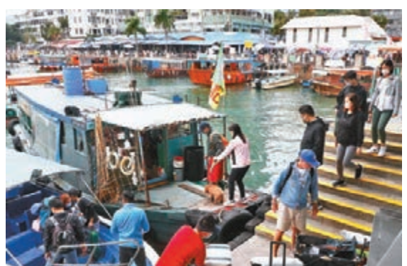
星期日期期的西貢依舊墟。

疫情反彈，但市民抗疫疲勞，昨趁周日紛紛到郊遊熱點遊玩。香港文匯報記者昨在中環碼頭和西貢巡察，發現不少市民前往離島或郊外。有市民由中環碼頭乘搭渡輪前往離島，雖然開口外未見出現人龍，但人流不絕，有市民表示在家困得久，故外出「啱吓氣」。西貢昨日亦人頭湧湧，往西貢碼頭更現車龍，不少市民相約一起郊遊，部分在草地上除下口罩野餐，更有市民沒有戴口罩行街。 另外，有不少人到攤檔查詢遊船的價格，街渡生意暢旺，有少數乘船者「脫罩」拍照「打卡」，隨時出現播疫風險。西貢不少食肆坐滿食客，更有食肆為多些生意，而在街上