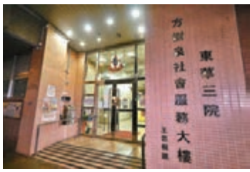
筲箕灣東華方樹泉安老院有院舍員工及宿友染疫。