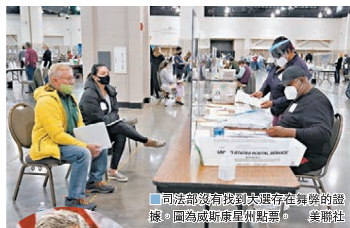
■司法部長沒有找到大選存在舞弊的證據。圖為威斯康星州點票。美聯社