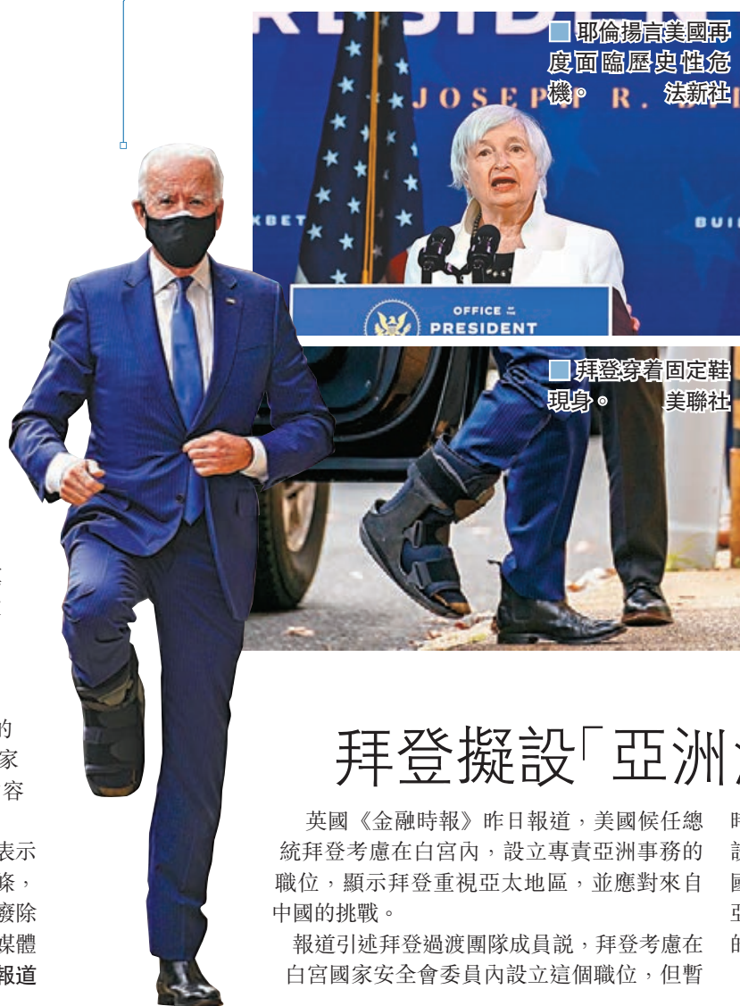
■耶倫揚言美國再度面臨歷史性危機。