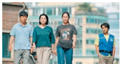
■ 電影《More Than Family》上個月已在韓國上映。

都不明白大人的事而沒有坦白，孩子又覺得雙親不聽自己的申訴是漠不關心；現世孩子早熟，科技發達的同時，希望大家還是要多溝通，多聆聽，坦誠相對互相了解體諒，珍惜擁有，活在當下。