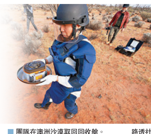
團隊在澳洲沙漠取回收艙。

JAXA團隊認為，「龍宮」的岩石保留了太陽系誕生前的痕跡，可能有助解答太陽系演化及地球生命起源等問題。 ■綜合報道