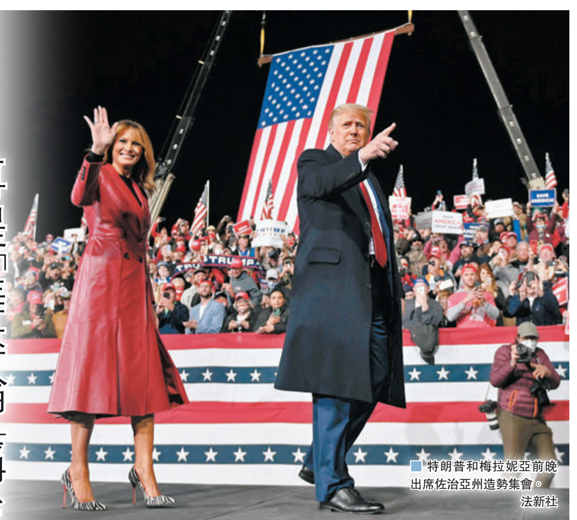
特朗普和梅拉妮亞前晚出席佐治亞州造勢集會。