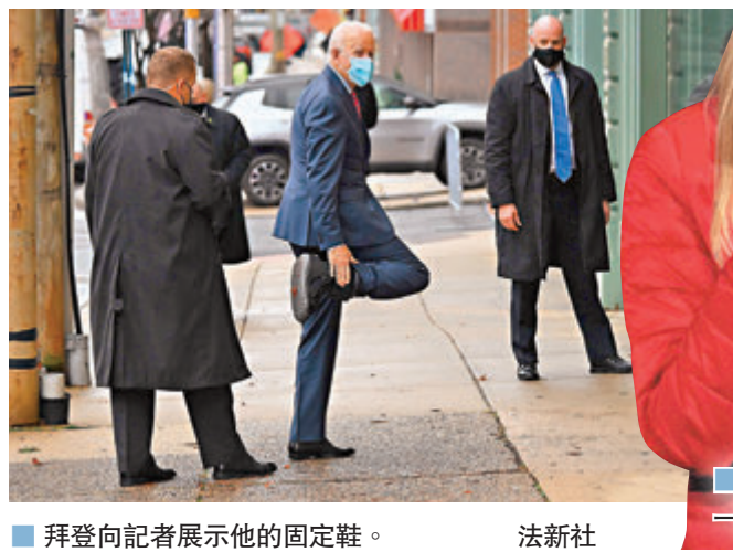
共和黨參院決選候選人之一的萊夫勒。