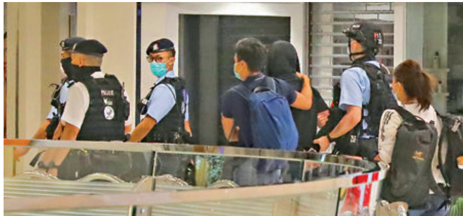
■當晚一名激進示威者擊毀新城市廣場「喜茶」店內的收銀機顯示屏和八達通處理器後被制服拘捕帶走。資料圖片

署理主任裁判官溫紹明指，被告所犯罪行及案情嚴重，但考慮被告年紀尚輕，認同家庭支持和監管對青少年罪犯改過自新尤其重要，而被告亦賠償涉案損失，以及上了寶貴一課；因此接納報告建議，判處被告200小時社會服務令。