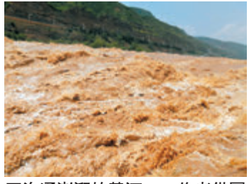
■洶湧澎湃的黃河。

朗，我看到千萬深黃色布匹猛烈向前滾動着，奔騰着……這些布匹從哪兒來的啊？啊！我看到了，原來黃河經此段的河面，本寬約300米，但在不到500米長的距離內，河面被突然壓縮到20—30米的寬度；此時的黃河，更遇上一個陡崖，經濟壓的河水，在20多米高的峭崖上傾注而瀉，形成「千里黃河一壺收」的氣概。此情此景，人人都忘我了，不約而同奔跑到瀑布邊，人人都發出驚呼聲，讚嘆聲；但是，我們只看到人們張開嘴巴，卻誰也聽不到誰的聲音。因為，我們在這裏聽到的，除了黃河的吼叫聲，就是黃河的咆哮聲！「風在吼，馬在叫，黃河在咆哮，黃河在咆哮！」這是真實的，但，您只能在這裏——壺口瀑布聽到和感受到，「不到黃河心不死」，「不到壺口聽不到」——這就是我們的壺口。擠到了那20多米的陡崖旁，黃河水就在這裏傾瀉而下，河水不懈地撲打着，不消5分鐘，我的身子濕透了，那全是黃泥水……站立在翻騰着的黃色布匹旁，我的耳邊響起了「保衛家鄉，保衛華北，保衛全中國」的雄壯歌聲，歌聲中，我彷彿看到那滾滾向前馳騁着的深黃色布匹，變成了千千萬萬個穿着深黃色軍服的士兵，士兵們奮不顧身和敵人奮力作戰，他們沒有猶豫，沒有畏懼，眼睛裏噴冒着憤怒的火焰，手握着土槍洋槍，揮動着大刀長矛，抱着必勝決心，向着欺壓、侵犯中華兒女的豺狼縱馬疾馳，貫頭奮戰，決一死戰！看啊！這就是澎湃的黃河，黃河用她英雄的體魄，築成我們民族的屏障，用她高尚的情操，哺育着我們的民族精神，讓我們中華民族世世代代堅毅不拔，偉大堅強！