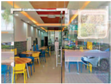
■兄弟努力之下，在東莞常平準備開張的港味小店！

我們最大的靠山是祖國，兄弟想通了，但還得有實力，不是說開便開，還好內地的條件比香港來說更適合年輕人創業，儘管前面還有不少困難要解決，又沒有什麼特別待遇，兄弟幾個還是下決心了。兩個月前落實，至今差不多要完成了，正在等待有關的不同的批文，小店便可以開張了！過程中他一向向我們匯報，每天看到他們的進度，實在很開心！兄弟少年時已很有天分，對美術、美食、影視都有濃厚興趣，此番在東莞開小店，更配合了回內地創業的機會，真是太高興！我們在香港的反而是看不到前景，什麼也做不到，尤其是已經下崗或因環境被迫無工可做，無處可逃，境況坎坷，相去甚遠！