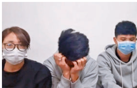
▲左起：女店主、男店主及員工昨日在fb直播認錯，但網民唔收貨。