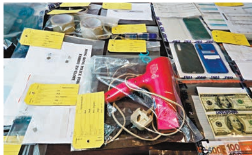
■警方在案中檢獲一套相信用來更換晶片的專門工具。

香港文匯報訊（記者 蕭景源）信用卡晶片難被盜取，竊賊出新招盜卡偷錢。一名假卡慣犯，在過去一年半內，潛入無保安的住宅樓宇或保安較鬆懈公共屋邨，盜走銀行寄給客戶的載有信用卡信件，拆開後用工具撬走晶片，再移花接木偽造另一張信用卡，並將晶片植入原卡，最後將信件復原放回信箱，以致卡主渾然不知新卡被盜，待卡主啟動信用卡但未有真正錄卡這段時間，疑犯用取得真晶片假卡和預設密碼，到櫃員機提款。而卡主要等到銀行通知，始知信用卡戶口被人盜用。警方日前拘捕疑犯，相信最少14名市民被盜32萬元。