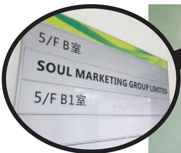
■現址大門外沒有標註是《成報》水牌（圖為），疑刻意隱藏其辦事處地址。

該名員工又說，該報一年多前由觀塘開源道遷往現址後，報頭下的地址卻未見更改，而現址大門外也沒有標註是《成報》水牌，疑是刻意隱藏其辦事處地址。