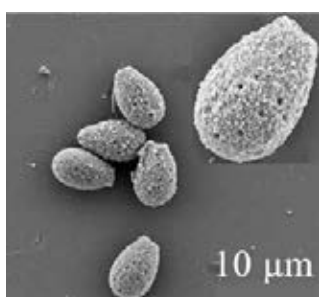
顯微鏡下的微型機械人。

「在經典科幻電影《奇妙旅程》(Fantastic Voyage)中，科學家駕駛被縮小的潛艇，變小到細胞尺寸，通過針頭從動脈進入病人體內……經歷千難萬險最終到達病人腦部，用鐳射手術槍消除了血液凝塊」，中大機械與自動化工程學系副教授張立介紹，這在上世紀五六十年代還只是科學幻想，今時今日雖然想把人體縮小仍是天方夜譚，但微型機械人已絕非空想。