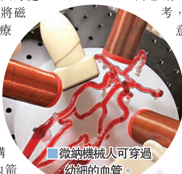
微納機械人可穿過幼細的血管。