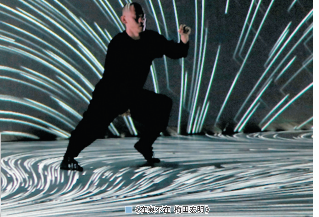
《在與不在 梅田宏明》

過去數年，西九表演藝術部舞蹈組與海外的藝術家及藝術機構建立起重要的聯繫，曾與澳洲、芬蘭、英國、新加坡、日本、法國等地展開合作及交流計劃。自2019年自由空間落成啟用以來，這種交流與合作擁有了更加穩定和實質的空間支持。通過「駐場」的形式，藝術家也可以擁有更加穩定的專屬創作空間，對作品進行深化。