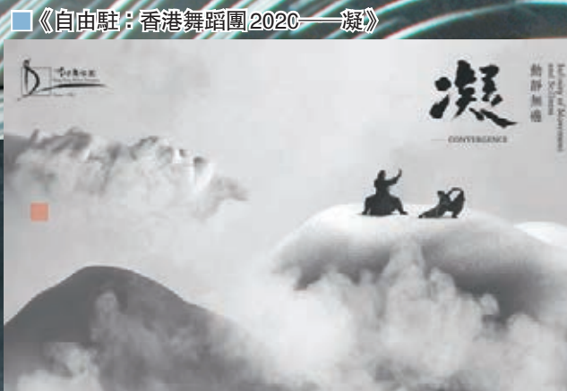
《自由駐：香港舞蹈團2020—凝》