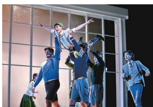
線上放映開售日期：即日起 購票詳情可參考 CITYLINE 網站 https://bit.ly/3oQbF4o

「彼得潘」被困在機場，如同卡在人生的裂縫中，進退失據，無處着力。2020年，我們如同被困在時間的裂縫中，經歷生死離別，現實如魔幻。經歷了翻天覆地的變化我們終於來到了今年的最後一個月，面對未來，我們可以如何重新出發？