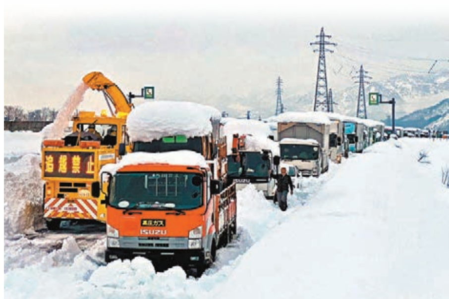
大批車輛被困雪中，車路延綿15公里。