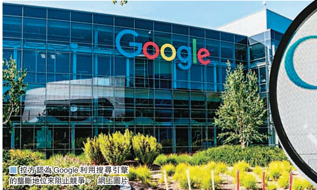
控方認為Google利用搜尋引擎的壟斷地位來阻止競爭。

互聯網巨擘Google在前日再被美國38個州份及地區入稟，起訴違反競爭法，是兩個月以來第3宗同類官司。新一宗訴訟針對Google搜尋引擎，控方認為公司利用搜尋引擎的壟斷地位來阻止競爭，並導致用戶慣性向公司提供個人資訊，最終損害消費者權益；Google一方則反駁，若公司因為敗訴而需要修改搜尋引擎，最終只會對消費者構成不利。