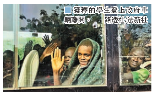
獲釋的學生登上政府車輛離開。

其中一名被綁架後成功逃走的17歲學生表示，綁架他們的武裝分子身穿軍服，成員中更有童兵，被綁學生事後被驅趕到叢林中，沿途不斷被鞭打，每當聽到直升機聲時，武裝分子都會要他們伏下或躲在樹蔭。