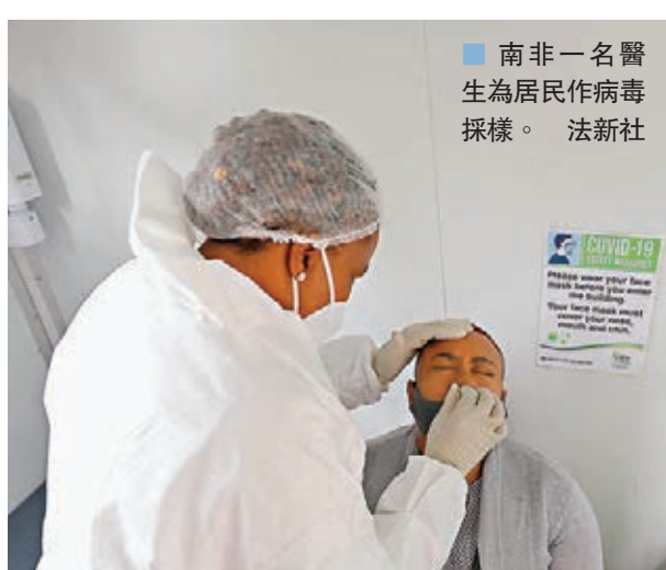
南非一名醫生為居民作病毒採樣。

南非總統拉馬福薩亦強調，今次沙灘畢業派對成為播疫活動，反映出部分年輕人負責任，若不及時作出改變，「這將是很多南非人的最後一個聖誕節」。綜合報道