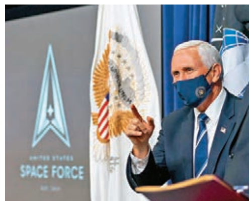
彭斯為太空軍命名「守護者」。

美國太空軍上周四在twitter表示，今次命名過程長達1年，指守護者在太空任務中具有悠久歷史，可追溯至美國空軍太空司令部1983年的指揮座右銘「高邊疆的守護者」。然而這名字引起網民熱烈討論，網站Military.com指出，「守護者這名字讓人想起Marvel的《銀河守護隊》(Guardians of the Galaxy) 系列電影。」綜合報道