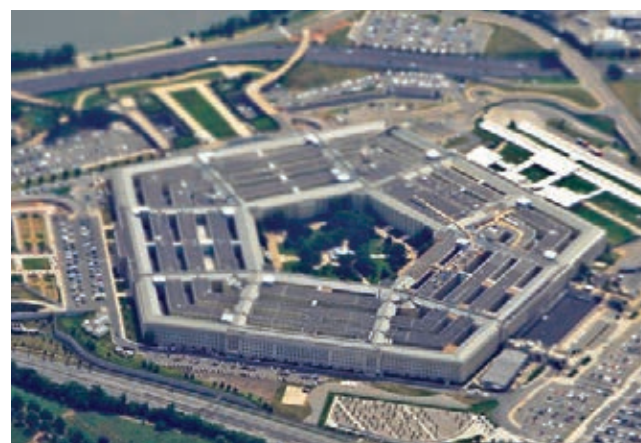
國防部前日起暫停向拜登團隊提供情報簡報。資料圖片

美國代理防長米勒前日晚發表聲明稱，國防部與候任總統拜登過渡團隊已就「聖誕假期安排」達成共識，國防部前日起暫停向拜登團隊提供國家情報簡報。拜登團隊反駁米勒說法，強調團隊並不同意在聖誕期間暫停交接工作，警告交接若被拖延，很可能造成國家安全風險。