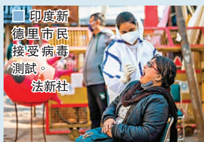
印度新德里市民接受病毒測試。

印度累計確診新冠肺炎病例昨日升穿1,000萬宗，單日新增確診25,152宗，較今年9月中每日增近10萬宗大幅下跌。衛生部數據顯示，昨日有