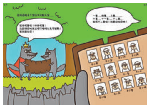
■ 涉事繪本竟以所謂「羊小富」、「羊小賢」云云化名，影射涉嫌違反香港國安法等罪行而潛逃的「12逃犯」。