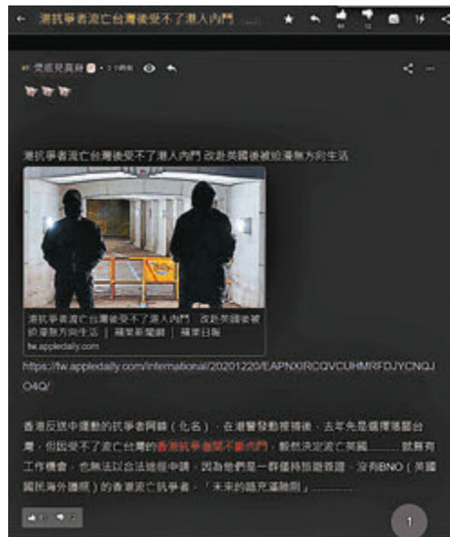
■「手足」係「連登」討論，點解佢地咁着草都仲要內鬥。