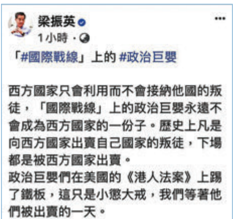
■梁振英指，「國際戰線」上的「政治巨嬰」永遠不會成為西方國家的一分子。

美國眾議院月初通過所謂「香港人民自由和選擇法案」，不過，該法案日前在參議院關關失敗。全國政協副主席梁振英昨日於社交平台發帖指出，西方國家只會利用而不會接納他國的叛徒，所謂「國際戰線」上的「政治巨嬰」永遠不會成為西方國家的一分子。 梁振英指出，一班推動所謂「國際戰線」的攪炒分子實際是「政治巨嬰」，然而西方國家只會利用而不會接納他國的叛徒。 他強調，歷史上凡是向西方國家出賣自己國家的叛徒，下場都是被西方國家出賣，如今「政治巨嬰們」在美國所謂的「香港人民自由和選擇法案」上踢了鐵板，只是小懲大戒，大家等着他們被出賣的一天。