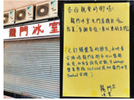
■龍門冰室嘅結業告示話，屯門店已於本月17日結業。

「黃色經濟圈」，你唔係到今日仲信呀？「黃圈」兩大龍頭近日又執兩間，包括早前高調稱要退出「黃圈」嘅「人血龍門」(龍門冰室)，其屯門店已於本月17日結業，而「光榮飲食」旗下嘅「全記點心專門店」，則將會於本月31日結業。有網民直言：「認為走政治(治)偏向，生意就能蒸蒸日上？自欺欺人，執埋合理呀！」 「光榮飲食」日前喺facebook發帖宣布，「全記點心專門店」做到本月底執笠，佢仲公開話收到業主通知，「加租20%……業主此番偉論，全記點心決定結業。」 唔少「手足」隨即就喪關「光榮」間舖個業主，仲話要起底同報復。好似「Fatfat Lam」咁講：「呢啲時勢仲加左(咗)(租)！擺明玩嘢。」「Sam Jones」就話：「開業主公開『處刑』啦。」「Mike Ho」則話：「呢個舖(舖)位之後做咩都唔幫襯，完。」「Jasón Sim」更話：「捉個業主出泥(嚟)打咗呢啲人。」做唔掂就想搵業主出氣，租界「黃店」就唔可以加租，「黃納粹」真係並非浪得虛名。 另外，「向香港警察致敬」專頁嘅日就上載吃張「人血龍門」嘅結業告示，