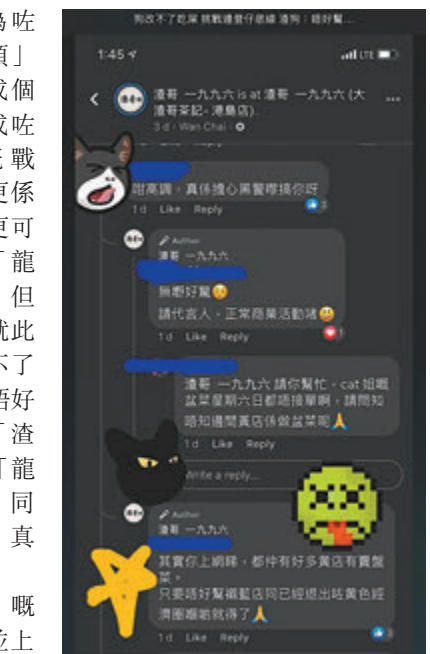
「渣哥」再次狙擊「龍門」，叫「黃絲」不要光顧「龍門」。網上截圖

疑似「渣家軍」嘅「Martin」話：「一事還一事……不過今時今日中立就係藍，叫人唔好幫襯『非黃店』有咩問題？」而「龍粉」「都得先生」就叫「渣哥」收聲，「收咗啲人渣，訂咗『龍門』盆菜今晚食。」