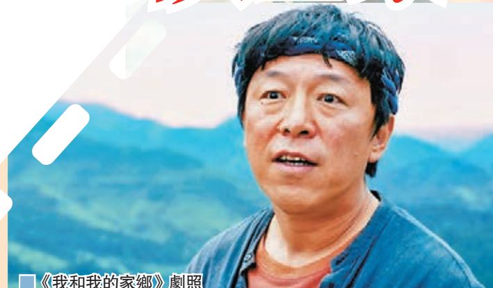
《我和我的家鄉》劇照

據悉，今年上映的影片有多部票房突破十億元，觀眾的支持與喜愛，令影院的清寂一掃而光，也為行業注入了生機與活力。其中，8月21日上映的《八佰》以31.09億元的累積票房遙遙領先，位列2020全年票房之首，佔目前綜合票房的18%，而國慶檔上畫的熱門影片《我和我的家鄉》以佔綜合票房16.4%的佳績緊隨其後，位列第二。