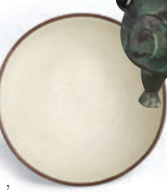
北宋/金定窯刻蓮紋大碗