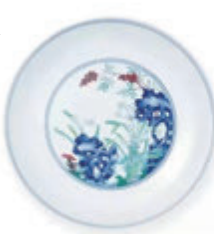
雍正門彩靈仙祝壽紋一對

同是雍正的精品，一對門彩靈仙祝壽盤，精緻令人愛不釋手。這對祝壽盤直徑：22cm，6年前上拍香港佳士得。雍正一朝，門彩御瓷淡雅柔麗讓人傾心，清新華美稱絕於世，歷為藏家所重。此芝仙祝壽圖盤是雍正禦窯之中的無上精品，冠絕千秋。其形後雅端莊，胎質細薄輕盈，釉汁瑩潤如玉，極具尊貴品格。這對祝壽盤內心繪以門彩