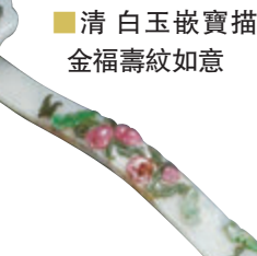
清白玉嵌寶描金福壽紋如意