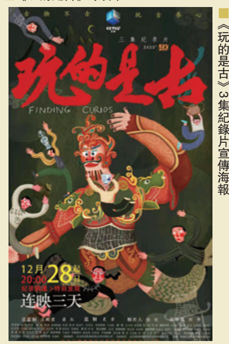
《玩的是古》紀錄片宣傳海報