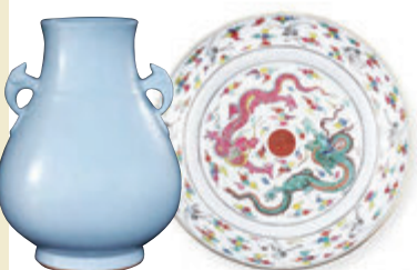
乾隆仿汝釉陶耳尊 雍正粉彩雙龍捧壽雲鶴紋大盤

書畫方面，趙孟頫、石濤都有好斬獲，另一件清代王翬的《嵩山草堂圖》絹本立軸同樣精彩，並且尺幅巨大，達186.5 x 100cm，十分罕見。此圖為有「清初畫聖」之譽的王翬，78歲高齡時創作的精彩佳作。本畫作絹本設色，畫風蒼茫渾厚，章法富於變化而染渲得法。畫面發端林巒，迤邐而進，黛螺蟬時，松繞寺門，雲氣沉山，亭尖半露，寺後群峰削立，層林迭嶂，再進山高雲厚，有抱琴策蹇者在徑查齋間，溪回路曲，上有茅亭，雲影山光。畫作以高超的藝術水平表現着水竹村居、杖笠樵漁、酒簾居角、犁犢田間、別浦潮通的那種晴嵐淑