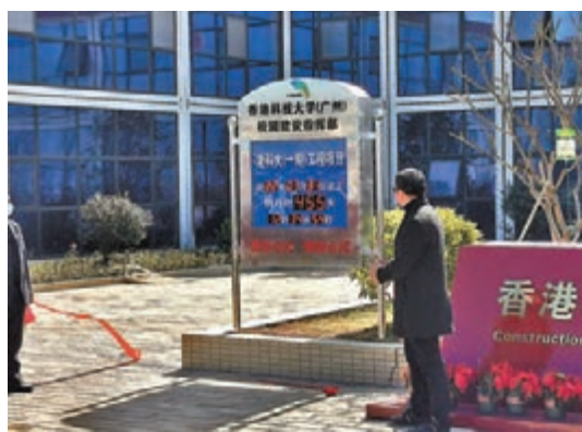
●港科大（廣州）校園建設全面完工倒計時啓動。

「一期工程建設包括校園設施、學生宿舍、員工宿舍、生活區、圖書館等部分。一期完工後可容納4,000名研究生，二期完工可容納4,000名本科生和2,000名研究生，兩期總計容納學生一萬名，整個項目的設計由美國公司主導進行。」鄭鐵星透露，參與項目建設的香港工程師、建築師將分為兩隊，其中13名來自香港的工程師在南