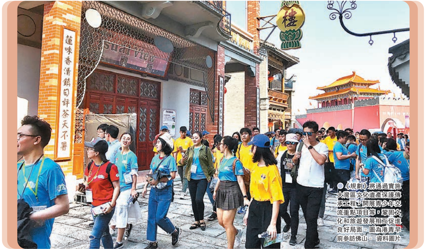
●《規劃》將通過實施大灣區文化遺產保護傳承工程，開展青少年交流重點項目等，鞏固文化和旅遊發展相互促進良好局面。圖為港青早前參訪佛山。

文旅部表示，《規劃》旨在全面準確貫徹「一國兩制」方針，支持港澳特區鞏固提升競爭優勢，充分發揮廣東改革開放先行先試優勢，支持港澳更好融入國家發展大局，推動粵港澳大灣區文化和旅遊交流合作與協調發展，建設具有國際影響力的人文灣區和休閒灣區。下一步，在粵港澳大灣區建設領導小組框架下，廣東、香港、澳門將加強溝通協調，依託粵港澳文化合作會議、粵港澳大灣區城市旅遊聯合會等文化、旅遊合作工作機制，推進規劃實施，確保《規劃》確定的主要目標和重點任務落實到位。