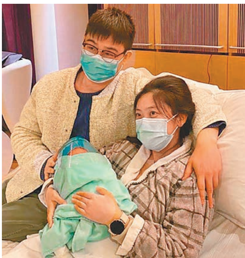
●穆太與丈夫對女兒成為元旦嬰兒感到高興，希望新一年所有人也順利和開心。

該名於仁安醫院出生的元旦女嬰重3.49公斤，父親姓穆，在國際學校當老師，母親則任職銀行。兩夫婦昨為新生女兒取名英文名字Mia，中文名則未定。