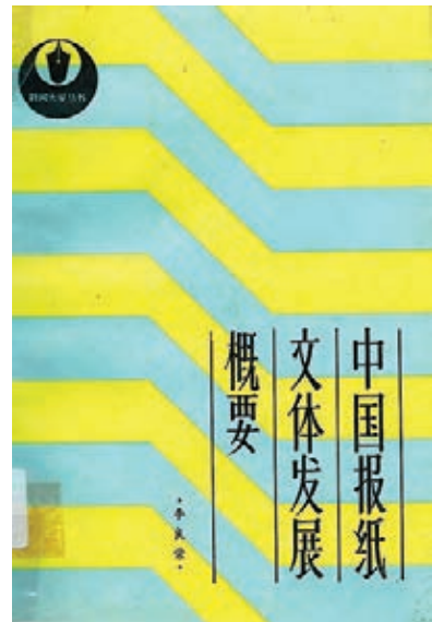
這書嫌簡略。