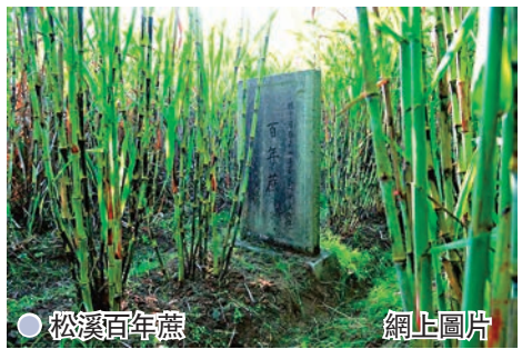
松溪百年蔗