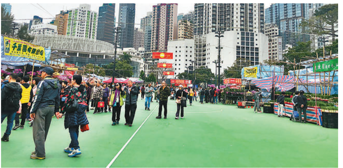
▶陳肇始透露，政府正評估是否應如期舉行年宵，暫未有定案。圖為去年初，市民到維園年宵市場逛。資料圖片