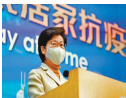
▲林鄭月娥強調，政府會採取逐步有序的方式，放寬社交距離措施。香港文匯報記者攝