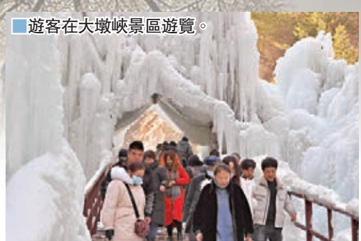
■ 遊客在大墩峽景區遊覽。