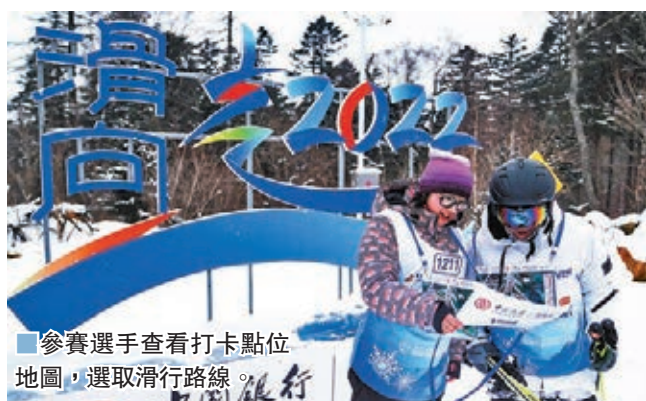
■ 參賽選手查看打卡點位地圖，選取滑行路線。

早前，作為第七屆全國大眾冰雪季系列活動之一的「中國銀行Visa信用卡」超級定點滑雪公開賽揭幕戰在吉林省北大湖滑雪度假區舉行，來自全國各地的300餘名參賽者踩着雪板穿行在「林海雪原」間，樂享這場結合高山滑雪與定向越野比賽元素於一體的雪山「尋寶之旅」。