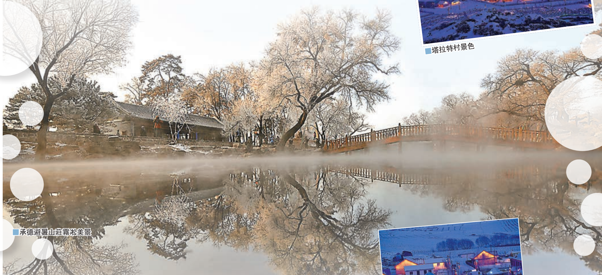
■ 承德避暑山莊霧凇美景