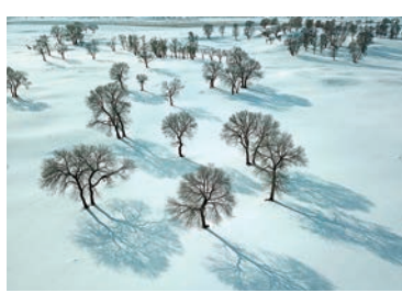
■ 御道口牧場管理區冬日景色

而位於壩上地區的河北省承德市御道口牧場管理區銀裝素裹，白雪、藍天、樹木構成一幅幅冰雪畫卷，美不勝收。至於地處大別山腹地的安徽省六安市霍山縣大化坪鎮迎來降雪，雪後的山林銀裝素裹，彷彿童話世界。