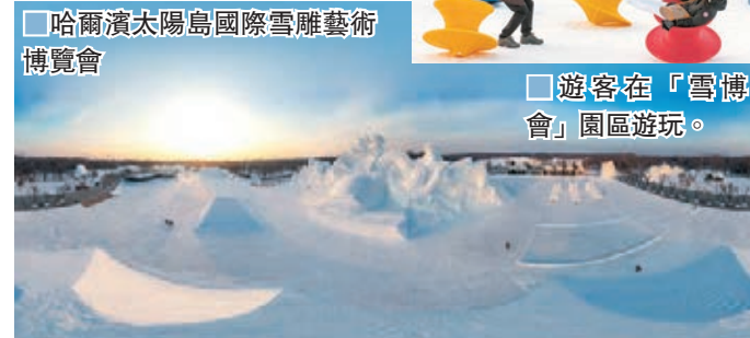
■ 哈爾濱太陽島國際雪雕藝術博覽會