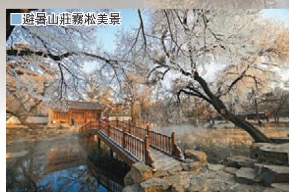
■ 避暑山莊霧凇美景