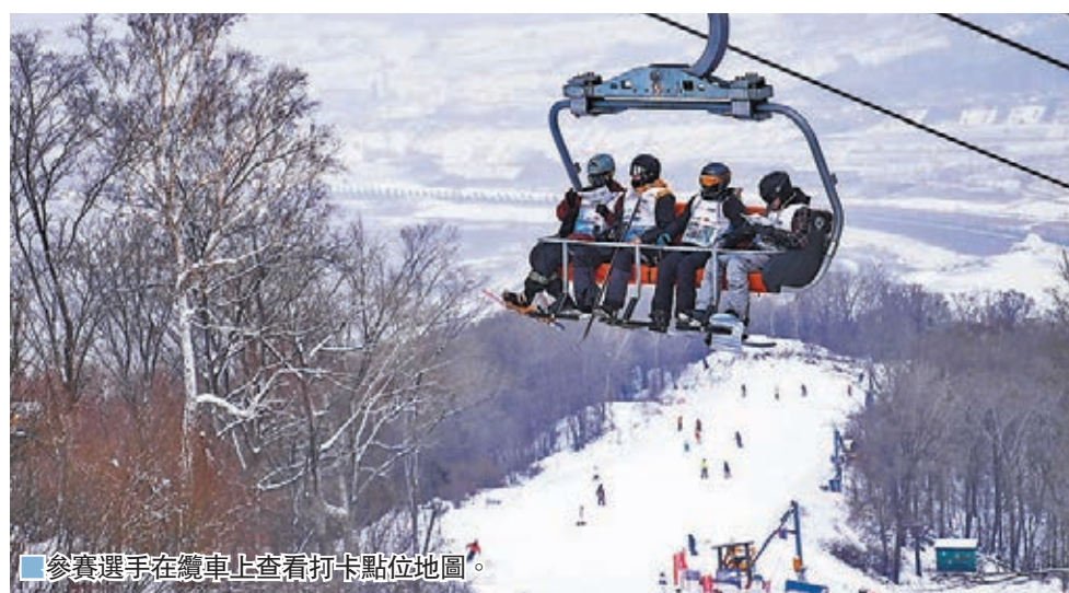
■ 參賽選手在纜車上查看打卡點位地圖。