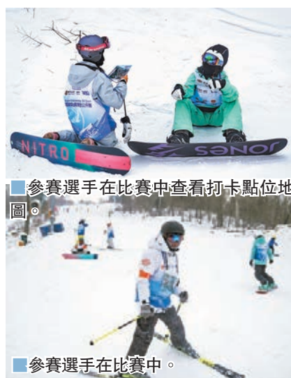
■ 參賽選手在比賽中查看打卡點位地圖。