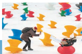
■ 遊客在「雪博會」園區遊玩。

近日，第三十三屆哈爾濱太陽島國際雪雕藝術博覽會開園迎客，走進「雪博會」就像走進了「雪雕博物館」，人們在園區內觀賞遊玩，暢享冬日「雪趣」。雪博會位於太陽島風景區內，靠近松花江，面積達幾十萬平方米，整個景區以雪為主線，設置了不同的主題區域，塑造了大量逼真的雪雕，遊客可以與它們近距離接觸。而且，場內還有大滑梯、冰場、雪地越野車、冰上碰碰車、雪地滑板等親雪體驗活動。