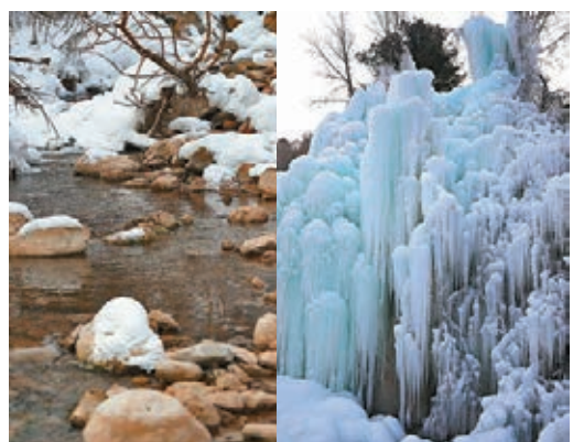
■ 渭源縣天井峽景區景色優美

這裏的山形乍一看是一體的懸崖陡壁，隨着遊人的移動，又在不斷變化，從谷底仰望驚險絕奇。山頂端一處冷泉，從懸崖上飛揚而下，垂成千尺白練。峽谷裏歡躍的淺溪，從兩崖之間奔來，匯成湍急的小河，將谷底沖刷成幾米深的石槽，飛跌而下，旋成明鏡般的深潭，清澈見底，泛綠映藍，五彩繽紛。天井峽，除了山奇水美外，還有許多奇花異草和珍奇野生動物，主要有獐、鹿、西門麟、野牛、金錢豹、藍馬雞、娃娃魚等。