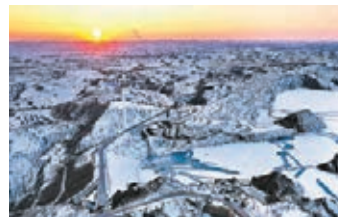
■ 雪後初霽的黃土高原

位於黃土高原的陝西省榆林市麻黃梁黃土地質公園雪後初霽，美景如畫。麻黃梁黃土地質公園總面積37平方公里，厚重的黃土層歷經千百年風雨的沖刷，形成了奇特的地貌景觀，令人嘆為觀止，成為人們旅遊、攝影的好去處。