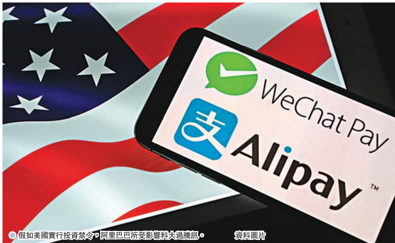
●假如美國實行投資禁令，阿里巴巴所受影響料大過騰訊。