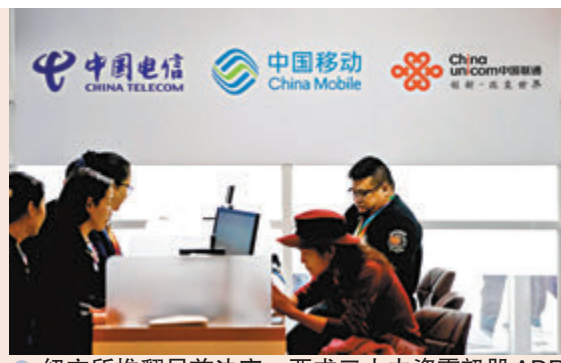
●紐交所推翻早前決定，要求三大中資電訊股ADR除牌。