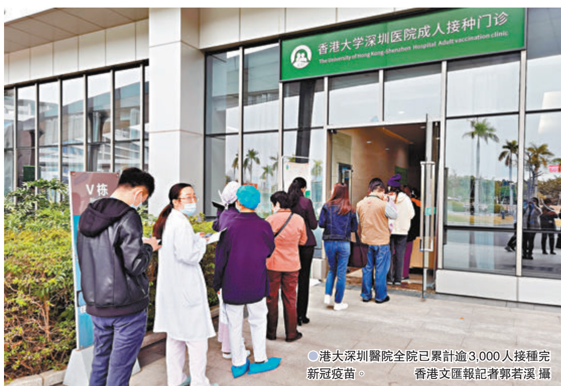
港大深圳醫院全院已累計逾3,000人接種完新冠疫苗。

「香港是很需要疫苗的，雖然疫苗不是唯一方法，但肯定能有效阻斷病毒傳播、降低病毒破壞力。」盧寵茂直言，香港還處在等待疫苗狀態中，已經比內地晚接種了，所以現階段港府需要盡早計劃疫苗接種的事宜。