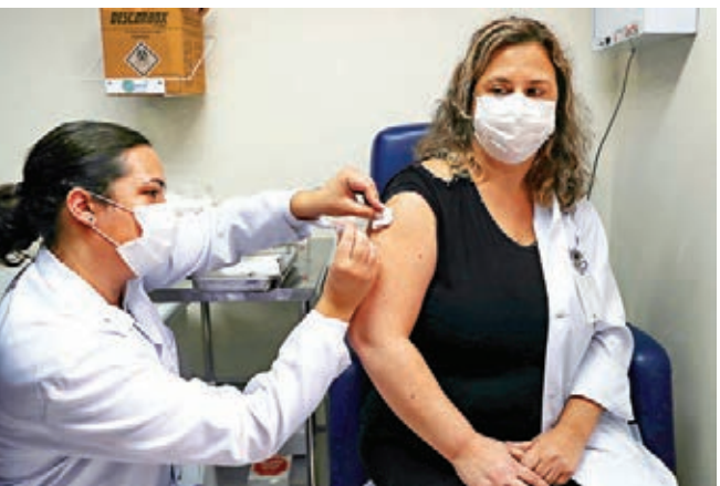
◀ 一名志願者去年7月在巴西聖保羅州接種中國科興新冠疫苗。

他以和中國疫苗監管體系相仿的印度血清研究所舉例說,這家機構號稱全球65%的兒童都用過它的疫苗,產品覆蓋170個國家,80%都出口,它的商業模式非常成功。