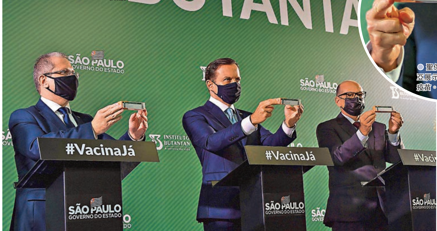
● 聖保羅州州長多利亞展示中國科興新冠疫苗。

● 巴西聖保羅州政府當地時間7日表示,中國科興研發的新冠疫苗在當地的第三期臨床數據顯示有效率為78%,其中對中、重症的有效率更高達100%。