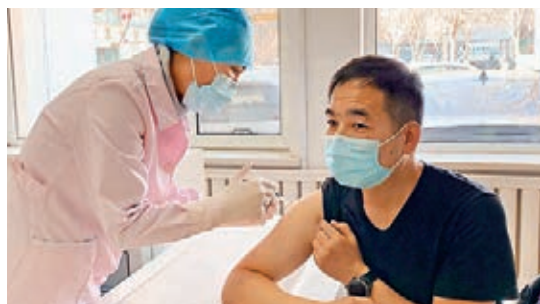
● 一位醫務工作者8日在瀋陽接受新冠疫苗第一劑接種。

據瀋陽市發改委新聞發言人劉耀國此前介紹,瀋陽市已於去年底採購了新冠疫苗20萬份。瀋陽市疾控中心副主任王萍則在7日表示,目前瀋陽已累計完成接種33,296劑次,並正根據風險等級,分批次做好重點人群的疫苗接種工作,同時保證疫苗接種的安全。根據受種人員數量和分布,目前已科學設置接種門診229個,其中已開放141個接種門診。後續將繼續擴大開放接種門診的數量,確保重點人群應種盡種。