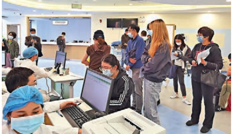
▶ 深圳市民積極接種疫苗。