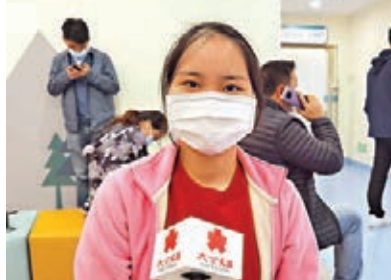
▲ 汪同學將在深圳接種第二針。

小陳說,她也有建議符合條件的同學,可以創造條件到深圳來接種,「在深圳,留學生是重點接種人群,可以優先排隊,但在香港就未必了,還不知道要等到何時呢。」