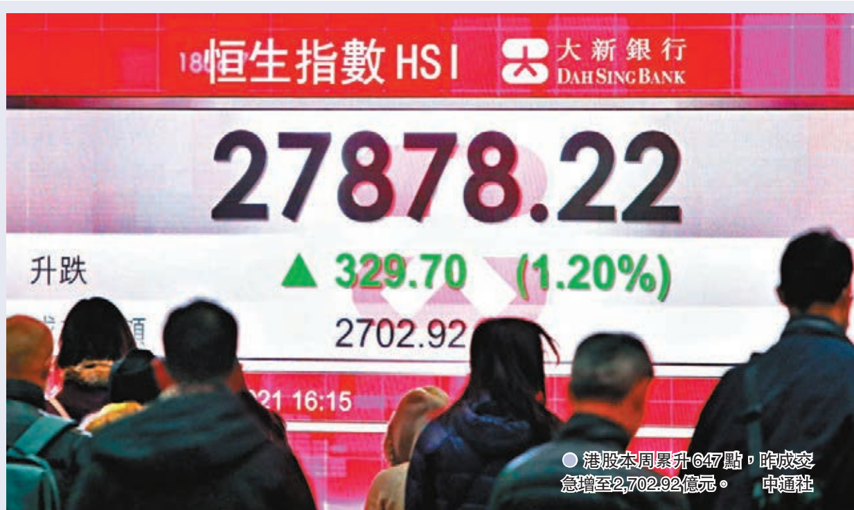
● 港股本周累升647點，昨成交急增至2,702.92億元。