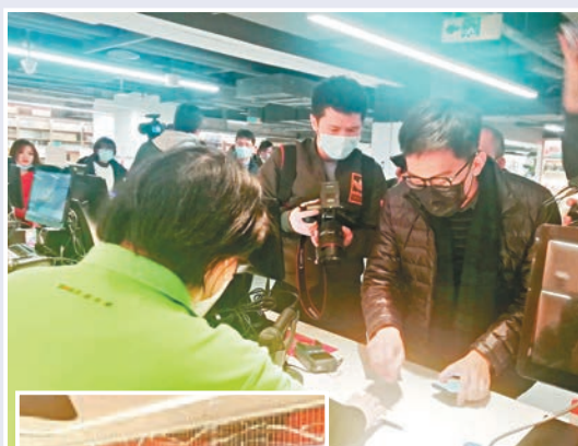
▲黃先生用200元數字人民幣紅包在中心書城購買了兩本書。