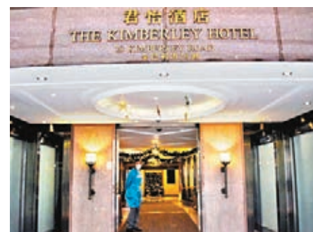
●36間指定酒店均有興趣繼續參與計劃，圖為尖沙咀君怡酒店。資料圖片

他強調，指定酒店控制嚴格，退休紀律部隊和衛生署牙科組別會協助巡查酒店，也有保安和閉路電視作監察，以保證檢疫者不可離開房間。