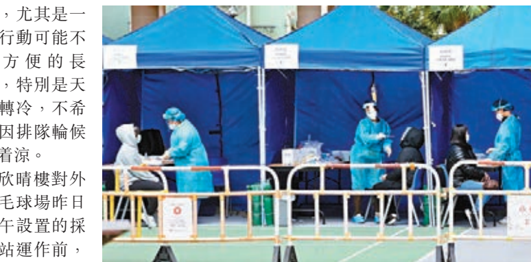
●啟晴邨欣晴樓流動採樣站。

同時，商場及街市亦有一系列強化防疫措施，除定期進行深層清潔和消毒等外，亦增聘約100名防疫大使，監察訪客量度體溫情況、勸喻訪佩戴口罩、監控商場及街市清潔