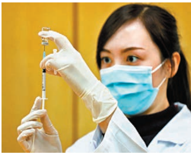
▲復星與BioNTech提供的新疫苗預料最快下月會抵港，社區疫苗接種中心將交由私家醫院及私營醫療機構運作。資料圖片