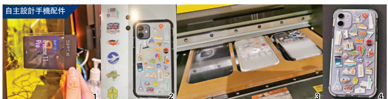
自主設計手機配件

更與風靡上世紀八九十年代的遊戲「食鬼」——《Pac-Man》合作推出多款40周年聯乘系列，更會推出充滿時代感的Cassette帶設計產品。零售概念店主打新客製化路線，以零售電子產品配件為主，同時設有e-shop讓顧客網上訂製產品。上至iPhone手機外殼（包括最新的iPhone12手機殼），下至Airpods、Apple watch、Macbook保護殼、iPad保護殼、T恤、衛衣等，品牌皆提供客製化選項。