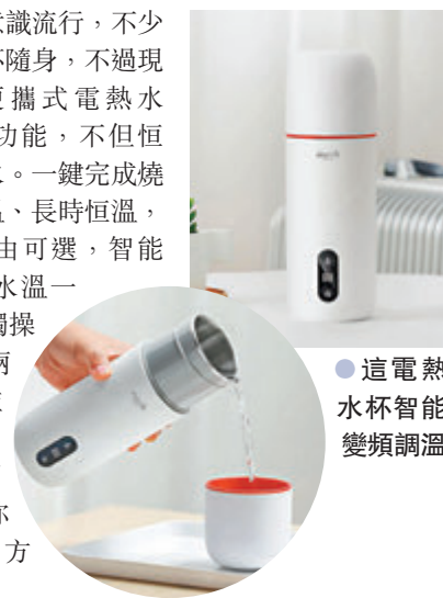
●這電熱水杯智能變頻調溫

隨着環保意識流行，不少人已有便攜杯隨身，不過現在Deerma便攜式電熱水杯，一杯多功能，不但恒溫，還能燒水。一鍵完成燒水、調節水溫、長時恒溫，40℃-90℃自由可選，智能變頻調溫。水溫一目了然，輕觸操控自由開啟兩大功能，並設3層隔熱防護，不銹鋼內膽，迷你350ml容量，方便攜帶。