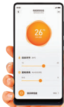
●智能連接Wi-Fi，通過App就能實現遠程控制。

當中，它可智能連接Wi-Fi，通過App就能實現遠程控制。賴在床上不起身，也能隨時開關，無論身在何處，都能暢享智慧生活帶來的便利。而且，它摒棄傳統的檔位設置，可支援攝氏16至32度自由調節溫度，內置雙溫度傳感器，智能恒溫，當環境溫度達到預設值，停止耗能，低於則自動加溫，將室溫控制在令人舒適的溫度，減少不必要的電量消耗。