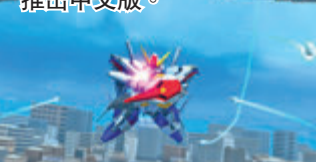
●《G世代創世》在Switch推出中文版。