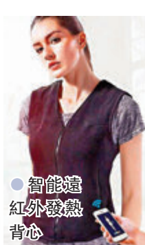
●智能遠紅外發熱背心

最近，香港天氣寒冷，早幾年也曾看到發熱背心，不過技術還未成熟，現在經過一輪研發後，Flexwarm全新發熱背心或外套，以智能遠紅外發熱保暖，穿上身後可手動或用App調溫，便會感到背暖笠笠。它採用充電寶供電，便攜安全，只需5v電壓供電，5,000mAh移動電源供電，低溫檔（藍色燈）最高可續航6小時。衣服自身沒有電池，可以穿着更安心，亦可直接水洗、摺疊及彎曲。