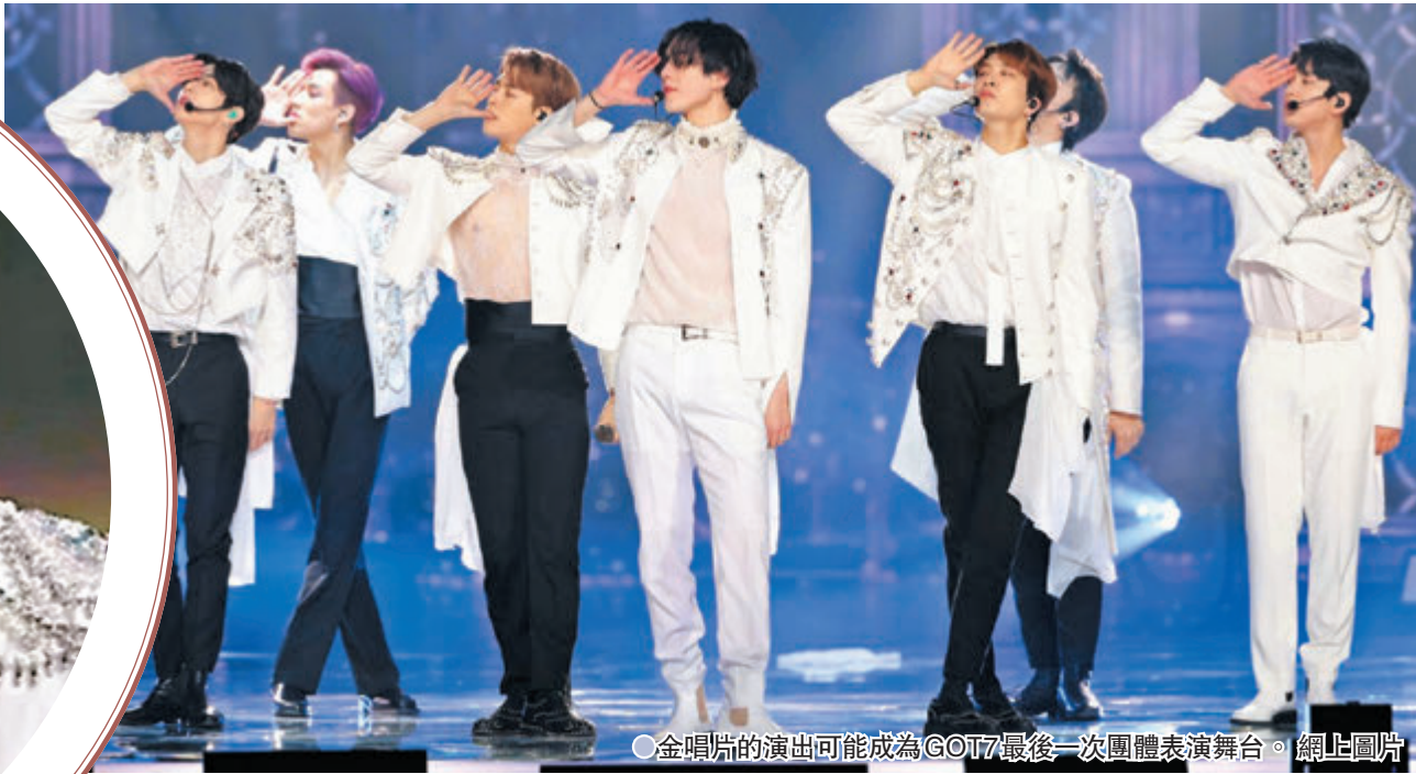
●金唱片的演出可能成為GOT7最後一次團體表演舞台。