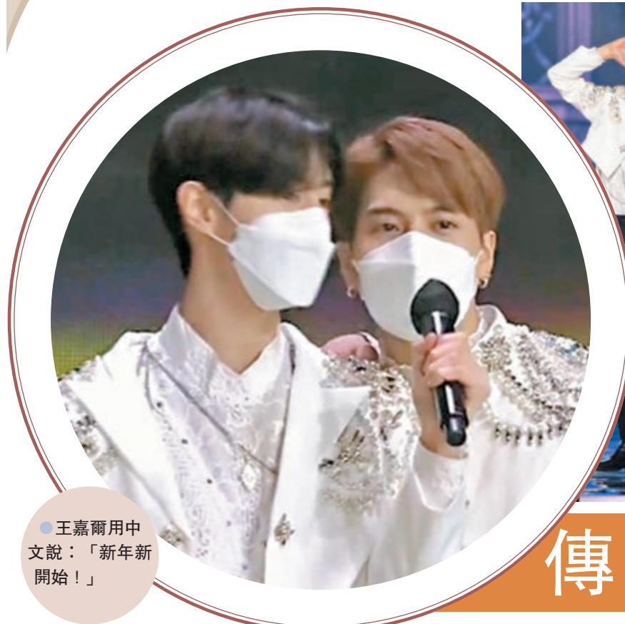
●王嘉爾用中文說：「新年新開始！」