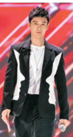
●黃曉明錄製《乘風破浪的姐姐2》。

隨後《乘風破浪的姐姐2》節目組，也在微薄發出聲明證實，並感謝黃曉明對節目的付出，以及對各位姐姐們的照顧，雙方合作很愉快，他們會尊重曉明的決定。