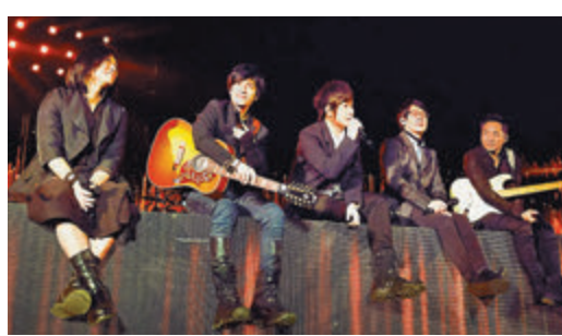
●阿信特別感謝醫護在防疫第一線的努力。

地震，全台多地均有震感，當中桃園最大震度3級，阿信也不忘抽空在facebook發文關心大家：「地震，大家都好嗎？」有現場歌迷回覆留言：「我在搖滾區完全沒感覺可能跳太高」、「在演唱會看台區，突然感覺到震動」。不過，有粉絲則笑問：「為什麼可以邊開演唱會邊發文？」