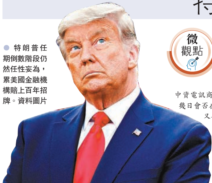
●特朗普任期倒數階段仍任性妄為，累美國金融機構賠上百年招牌。