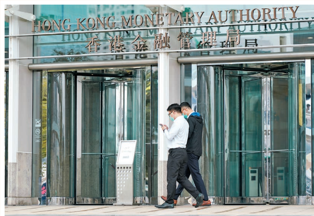
●金管局指，道富事件雖未有對盈富基金投資者造成實質影響，但卻造成不必要混亂，未來會繼續注視相關事情的發展。