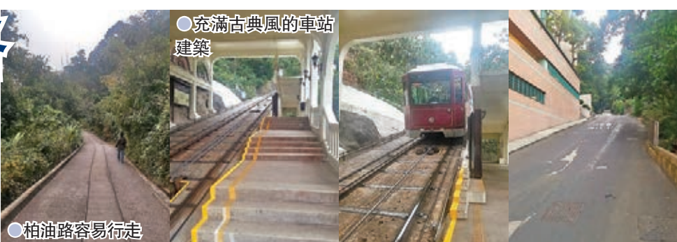
充滿古典風的車站建築

舊山頂道全長1.7公里，而由山頂凌宵閣到半山地利根德里一段約1.2公里的道路是禁止行車的，每日都有不少行山人士、跑友等經舊山頂道往來山頂，間中亦有山頂及半山居民沿路放狗。每逢假日，不少家長會帶同子女一同行山，享受親子之樂。舊山頂道雖然已有近百年歷史，但整段都是柏油路，步行難度不大，不過由於1.2公里的路段海拔相差約200米，部分路段的斜度較高，經過時要注意安全，不宜走得太快。沿舊山頂道下山，中途會經過山頂纜車白加道站。白加道站是山頂纜車其中一個中途站，始建於1888年，整個車站以白色為主色調，一磚一瓦充滿古典風格，因此吸引了不少攝影愛好者於此站拍攝取景，甚至亦有製作公司在此拍攝MV及廣告等。黃凱芹的《傷感的戀人》MV，就是在此取景拍攝。攝影愛好者都喜歡拍攝纜