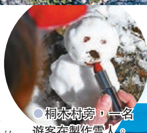
桐木村旁，一名遊客在製作雪人。

的九曲溪、夾岸矗立的三十六座奇峰（最有名的是玉女峰）和九十九座山岩，平均海拔350米。武夷山風景區屬於亞熱帶氣候，有450種以上的脊椎動物、5000種以上的昆蟲、2500種以上的植物，特產武夷岩茶，最高級的品種是大紅袍。而且，寒潮過後，福建武夷山國家公園執法支隊隊員也會到桐木村附近的茶園山景巡視，排查冰雪天氣可能帶來的安全隱患。