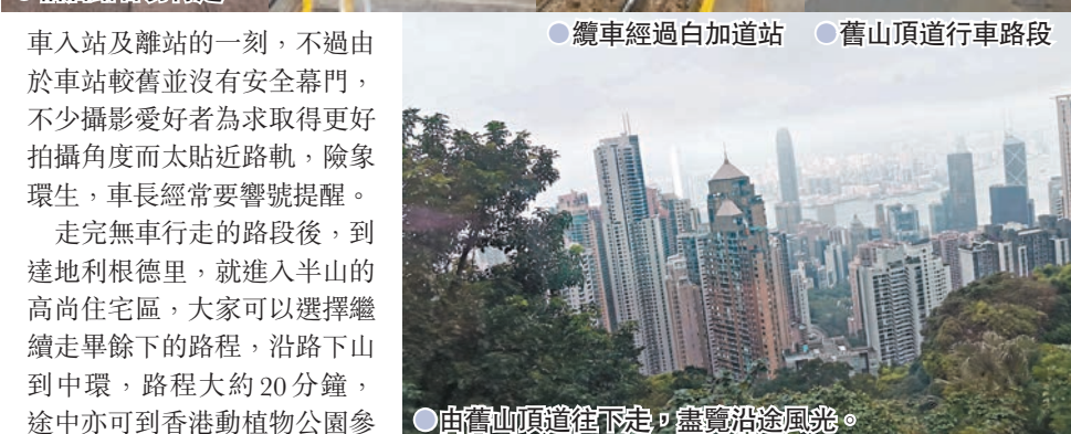
由舊山頂道往下看，盡覽沿途風光。

車入站及離站的一刻，不過由於車站較舊並沒有安全幕門，不少攝影愛好者為求取得更好拍攝角度而太貼近路軌，險象環生，車長經常要響號提醒。走完無車行走的路段後，到達地利根德里，就進入半山的高尚住宅區，大家可以選擇繼續走畢餘下的路程，沿路下山到中環，路程大約20分鐘，途中亦可到香港動植物園參觀。如果走累了，還可以在此乘坐小巴2號線，直接前往中環香港站。舊山頂道除了作為離開山頂的下山途徑，當然亦可以往上走前往山頂。不過正如前文所講，短途途徑斜度不低，因此很考驗體力，幸好沿途亦有座椅可供休息，而且中段還有廁所可以使用，方便行山人士。 文、圖：哈利醬