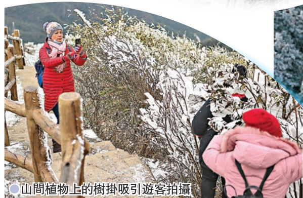
山間植物上的樹掛吸引遊客拍攝