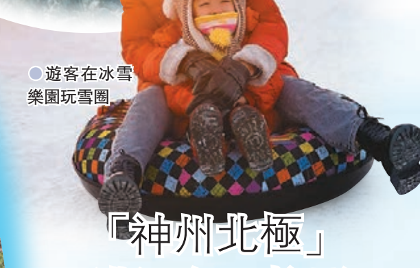
遊客在冰雪樂園玩雪圈