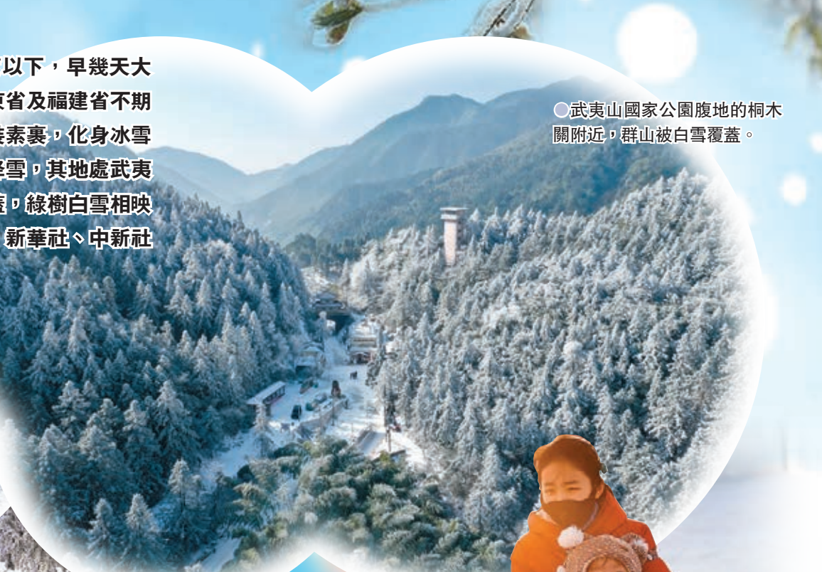
武夷山國家公園腹地的桐木關附近，群山被白雪覆蓋。