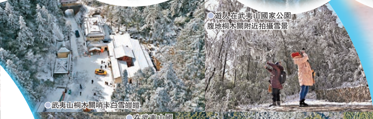
遊人在武夷山國家公園腹地桐木關附近拍攝雪景

清遠金子山銀裝素裹吸客 在寒冷的天氣下，廣東省清遠市金子山銀裝素裹，化身冰雪世界，遊客行走山間步道上，山間植物上的樹掛吸引遊客拍攝。在山頂平台上，遊客還將雪拋向空中，呈現一遍冰雪美景。其實，金子山上原生態休閒度假旅遊區佔地面積15000畝，主要建設內容包括登山步道、涼亭、觀景台等遊覽設施，還有遊客中心及廣場、鄉村度假旅館、農家菜館、壯麗風情探秘村等。景區位於粵湘桂三省結合部，是粵湘桂三省邊界風光旅遊的必經之地，景區主峰海拔1417米為廣東第八高峰，景區定位：登高盡覽粵湘桂三省邊城風光，三省自駕車遊接待基地、觀光覽勝、探險獵奇、避暑療養、度假休閒、科學生態旅遊功能於一身的綜合性休閒旅遊度假景區。