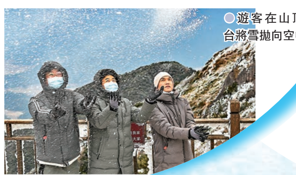
遊客在山頂平台將雪拋向空中

清遠金子山銀裝素裹吸客 在寒冷的天氣下，廣東省清遠市金子山銀裝素裹，化身冰雪世界，遊客行走山間步道上，山間植物上的樹掛吸引遊客拍攝。在山頂平台上，遊客還將雪拋向空中，呈現一遍冰雪美景。其實，金子山上原生態休閒度假旅遊區佔地面積15000畝，主要建設內容包括登山步道、涼亭、觀景台等遊覽設施，還有遊客中心及廣場、鄉村度假旅館、農家菜館、壯麗風情探秘村等。景區位於粵湘桂三省結合部，是粵湘桂三省邊界風光旅遊的必經之地，景區主峰海拔1417米為廣東第八高峰，景區定位：登高盡覽粵湘桂三省邊城風光，三省自駕車遊接待基地、觀光覽勝、探險獵奇、避暑療養、度假休閒、科學生態旅遊功能於一身的綜合性休閒旅遊度假景區。