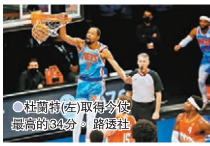
●杜蘭特(左)取得今役最高的34分。