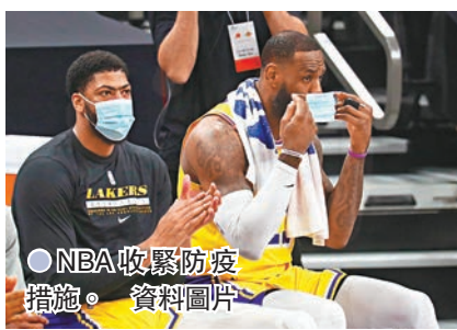
●NBA收緊防疫措施。資料圖片

NBA官方和球員工會昨日公布了接下來14天的新防疫措施，其中球員在主場賽事與球隊職員必須留在家中，只有參加球團相關的活動如練球，或因生活需求才能外出；至於客場比賽除了練球或緊急狀況，球員將不允許離開飯店以及和訪客交流。球員於飛機和比賽板凳區只能坐在指定位置，而場邊將設置座椅相距12呎的「冷卻區」，被換下場的球員可不戴口罩坐在冷卻區，之後