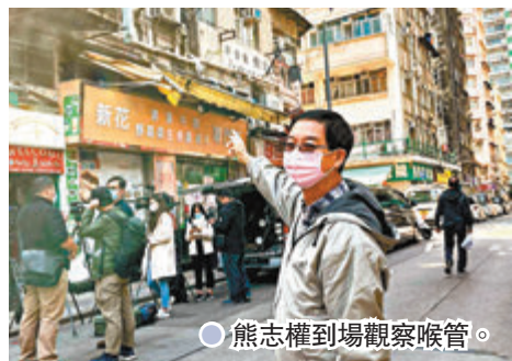
●熊志權到場觀察喉管。

新填地街一帶「小尼泊爾」之稱，吸引大批尼泊爾人聚居，他們大多從事地盤工作，隨着日出康城、將軍澳藍田隧道、中九龍幹線中段隧道地盤連「爆疫」，染疫工人將病毒帶入居住的社區，令新填地街一帶過去兩周(未計昨日)已累積81宗確診個案。有商販居民擔憂該區疫情發展，希望政府加強全區防疫工作，並強制居民接受病毒檢測。衛生防護中心傳染病處主任張竹君表示，會考慮強檢建議。