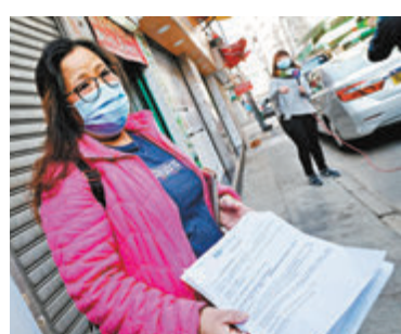
●有居民對送檢安排感到彷徨。