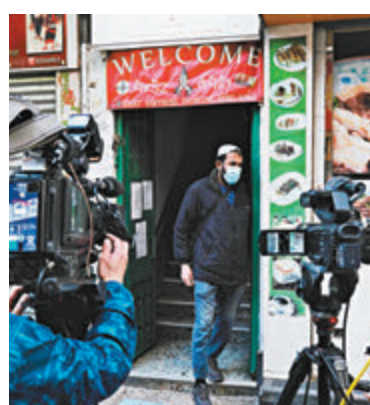
●仍有不少住戶未能安排送往檢疫。