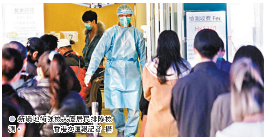
●新填地街強檢大廈居民排隊檢測。