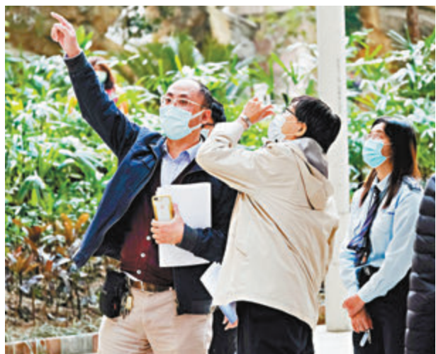
●袁國勇昨午到場視察並檢查喉管。