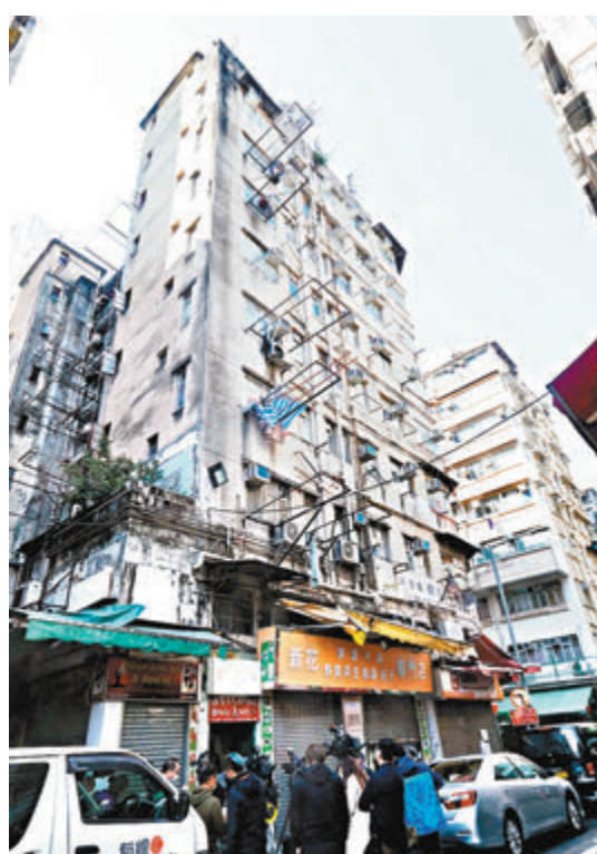
●佐敦新填地街20號至26號4幢大廈累計29人染疫。衛生署昨晨撤離所有居民送往檢疫中心。

附近一名水果檔檔主表示，理解政府為防止居民「望風而走」突擊行動，但認為缺乏後續配套措施，留下諸多漏洞，擔憂病毒已經四散，「有人朝早先返來未撤離，這些人可能已經偷走了。」她認為若爆疫之初政府可將所有居民登記在冊，就可減少錯漏，「就算佢哋走咗或者未返來都搵得返有補救。」