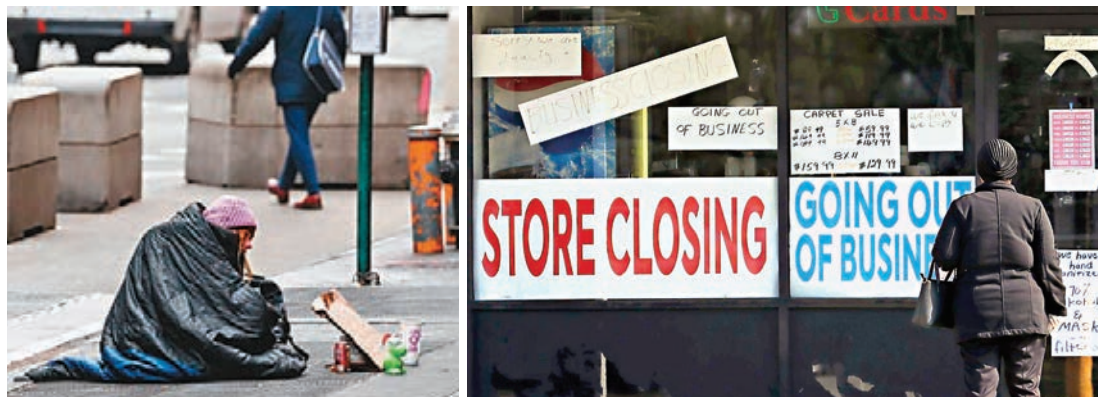
●美國經濟疫下受重創，不少民眾及行業極需援助。