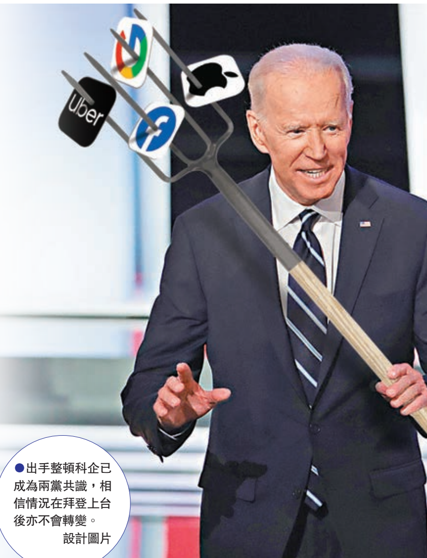
●出手整頓科企已成為兩黨共識，相信情況在拜登上台後亦不會轉變。設計圖片

facebook (fb)、Google 和蘋果公司等科技巨擘，已成為支撐美國經濟的重要企業，但科企的影響力愈來愈大，政界對科企的批評聲音亦日益激烈，除了批評科企壟斷外，更不滿社交媒體「歧視保守派聲音」，因此倡議撤銷保護科企的法例，令社交媒體需為平台上的不當內容負上刑責。隨着白宮即將易主，候任總統拜登招攬矽谷界人士擔任顧問，科企期待可讓他們「逃過一劫」，不過從多州聯手針對科企展開反壟斷訴訟來看，政界早已不再信任科企，出手整頓科企已成為兩黨共識。