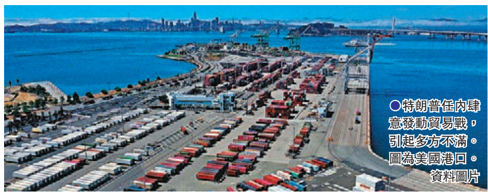
●特朗普在內閣意欲發動貿易戰，引起多方不滿。圖為美國港口。資料圖片