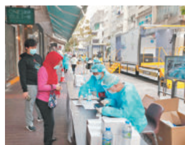
●大批居民到社區檢測中心及流動採樣站檢測。

發言人指明愛醫院已於該名初確護士的工作地點進行徹底清潔消毒，並繼續密切監察有關員工及病人健康情況。