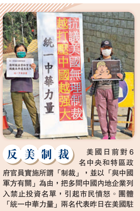
●香港文匯報記者 子京

店嘅珍珠都整唔好,非奶類嘅飲品全部都勁化學味。有同病相憐嘅網民就回應繼續鬧,話「茶一」啲飲品全部藥水味,更加有人話,試過啲杯飲品食到隻蟻嘍。 另外,好多人話難食嘅「黃店」仲有觀塘「小時光」、被稱為垃圾茶店嘅「渣哥」等,當然唔少得退出咗「黃圈」但仲可以食「黃水」嘅「龍門」啦。 除咗鬧「黃店」服務差、食物難食外,仲有好多人話大部分「黃店」係靠吹捧,根本係過譽咁話。有網民就講話,「早排風氣係話扮「黃」都唔介意,最好全城「黃店」,預左(咗)好多牛鬼蛇神混入撈油水。」亦有網民直指好多都係假「黃店」,個個打住「黃店」嘅旗號去賺錢。 不過,即使有人講咗個真相出嚟,都仍有啲「黃絲」甘願,話會繼續支持「黃店」,畀機會佢哋再去改善,仲有人封鎖埋鬧「黃店」嘅「黃絲」睇。見到一班「黃絲」俾人呢慣呢熟都選擇繼續盲撐,真係唔係佢哋咁傻好呀?