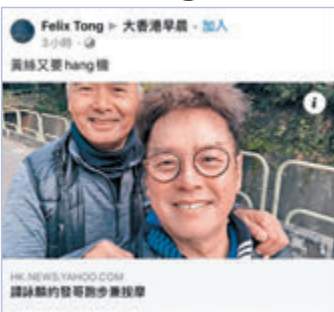
●有網民轉載發哥(左)與譚校長(右)的合照。

郁啲就話要「割席」、要批鬥,仲會妄想自己有能力封殺人哋。難怪網民「Felix Tong」轉帖譚詠麟同發哥合照時話:「『黃絲』又要hang機。」 其實「黃絲」嘅「割席文化」流行咗咁耐,相信唔少人都已經見慣不怪了。好似邊間公司嘅產品搵咗某網藝員代言又話要「割」、[黃絲]KOL同建制派拍片又話要「割」、搭港鐵嘅「手足」都要「割」。或者一班「黃絲」會以為俾佢哋「割席」嘅影響力