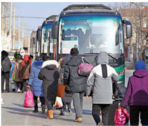
●1月11日，石家莊藁城區增村鎮北橋寨村村民們正有序轉移隔離。