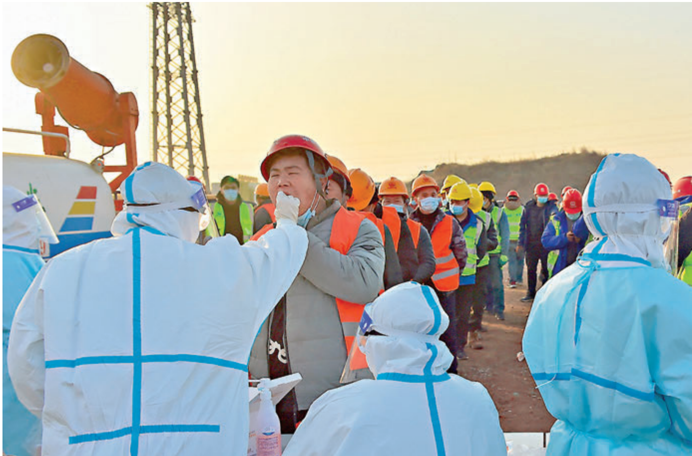
●1月18日，石家莊黃莊隔離場所建設工地人員進行核酸檢測。

馬曉偉強調，近期幾起疫情均由境外輸入導致。一些地方在防控過程中出現鬆懈麻痹和消極對付現象，應急指揮體系未能快速激活。要健全常態化向應急及時轉換的指揮體系，切實做好各項應急處置準備，提高應急處置科學性精準性，加強農村地區疫情防控工作。