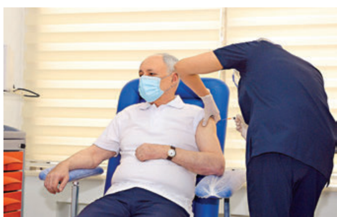
●1月18日，阿塞拜疆衛生部長奧格塔伊·希萊里耶夫(左)在阿首都巴庫接種中國新冠疫苗。

據阿塞拜疆政府設立的抗疫指揮部17日發布的消息，該國新增確診病例322例，累計確診227,273例，累計死亡3,009例，累計治癒215,268例。