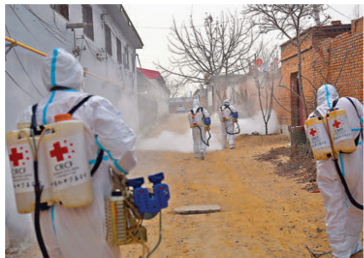
●1月14日，志願者在石家莊新樂市蘆新村開展消毒工作。