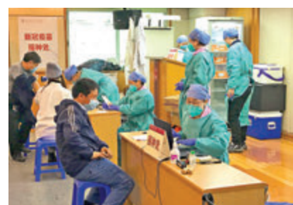
●廣州出租車司機在接種疫苗。

張周斌還表示，我國現在緊急使用的新冠疫苗都是兩劑次的免疫程序，建議在第一劑後不少於28天再接種第2